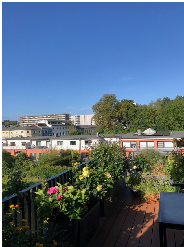
Süd - Balkon