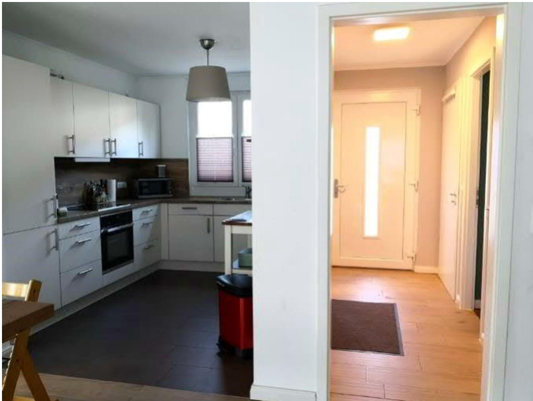
Küche und Flur EG