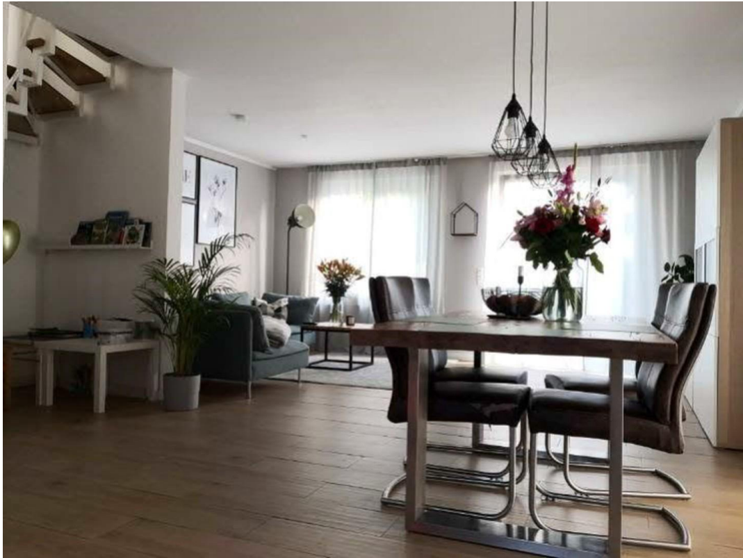
Wohn- und Esszimmer EG