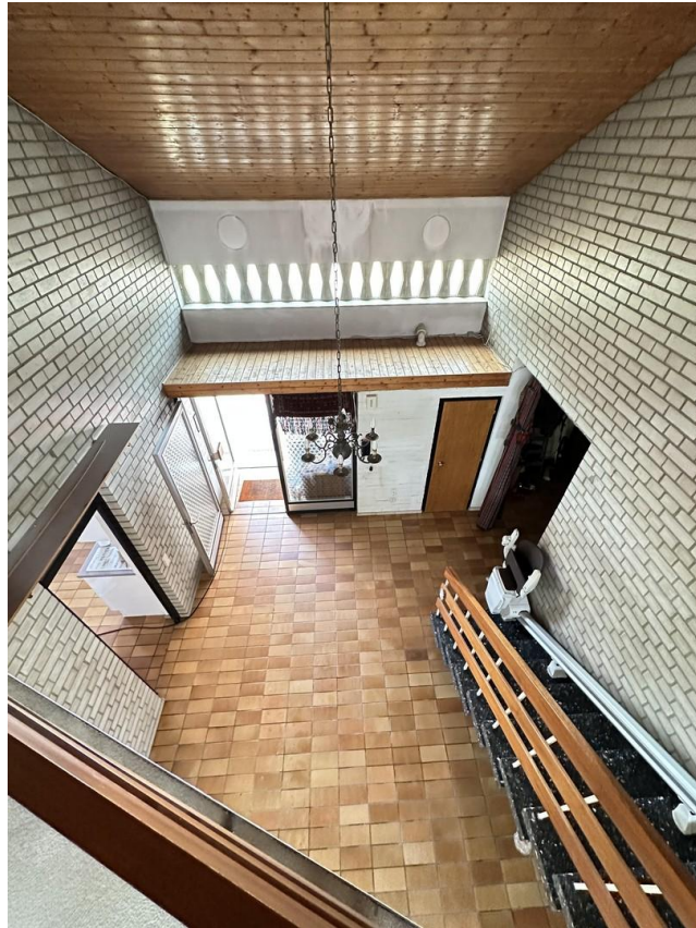
Galerie Blick zur Haustür