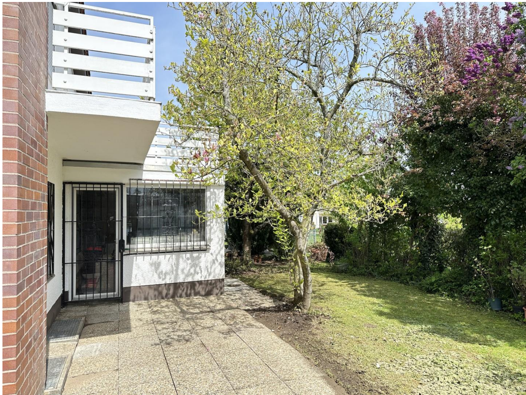
Garten Blick auf Werkstatt