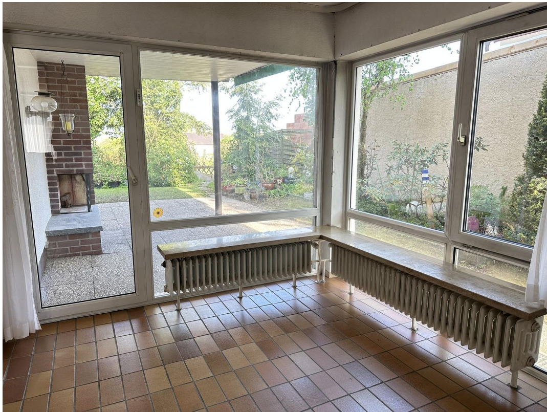
Esszimmer mit Blick auf Garten