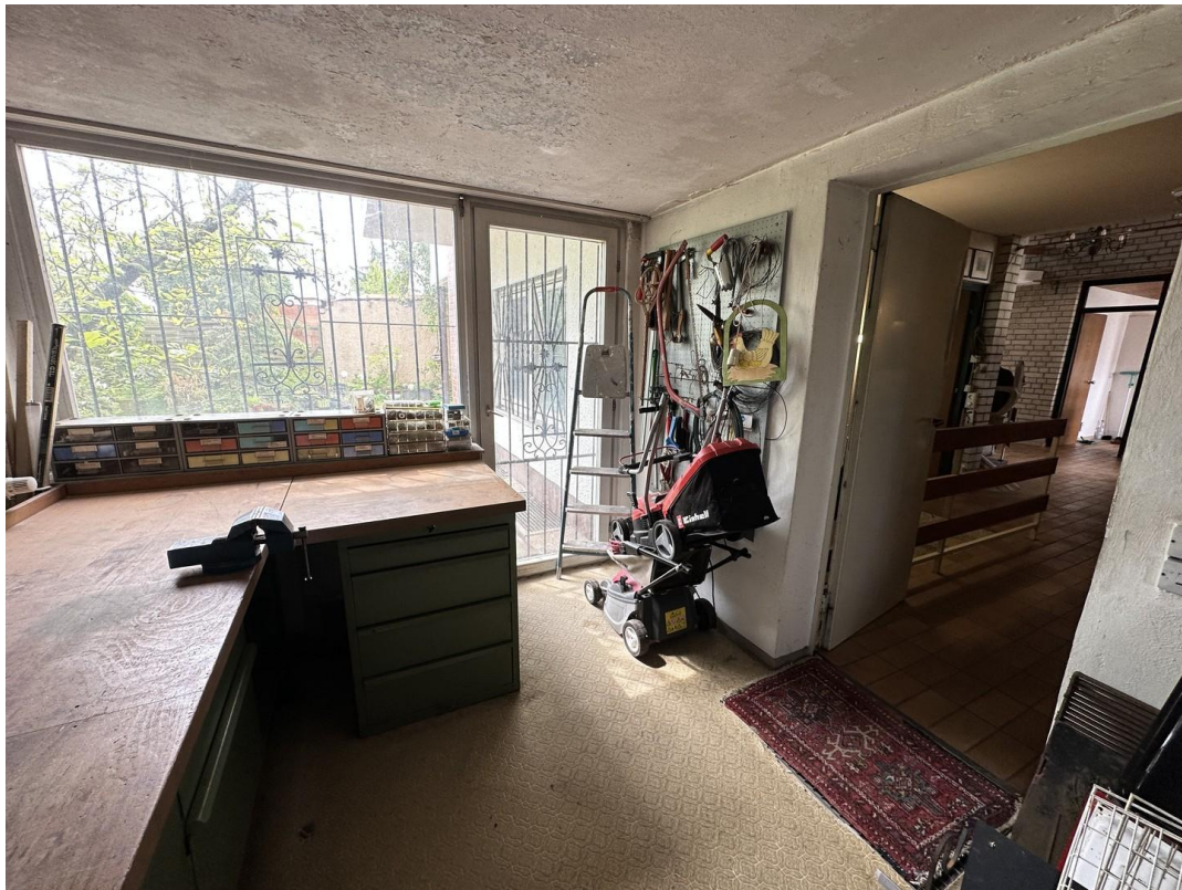
Werkstatt Blick ins Haus