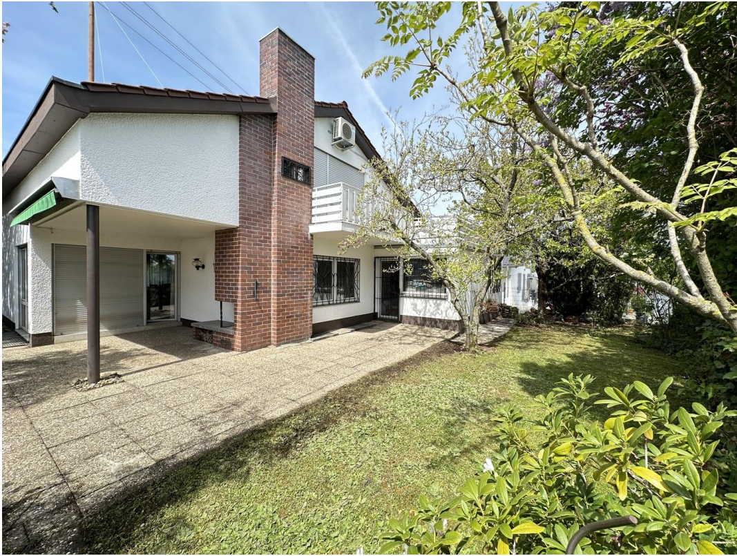
Garten Blick auf Terrasse