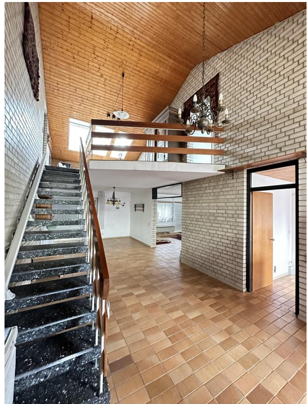
Aufgang zur Galerie