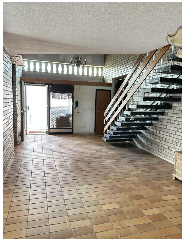
Esszimmer Blick zur Haustür