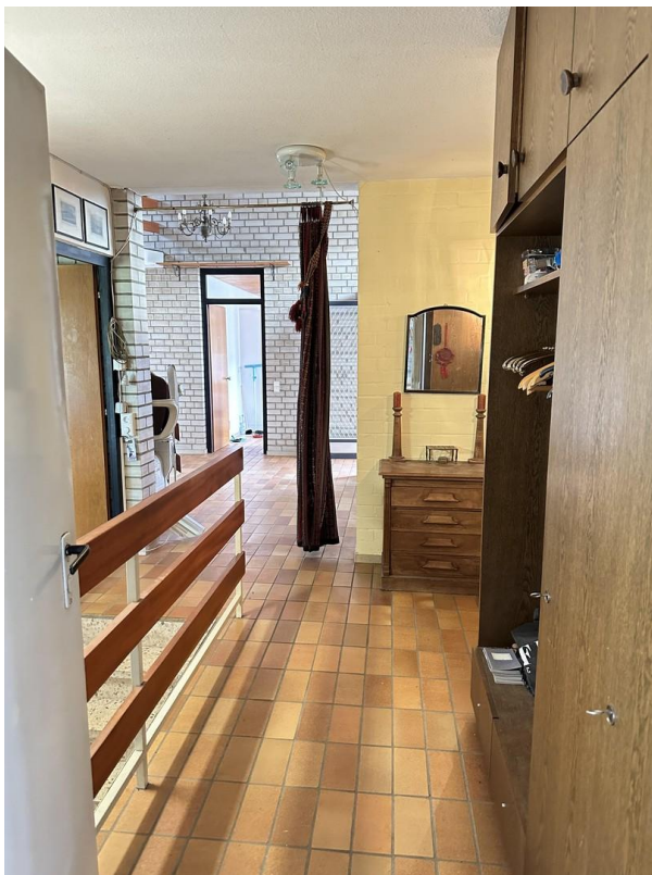
Garderobe, Blick aus Werkstatt