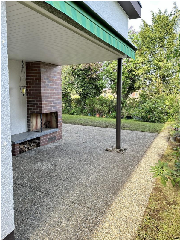
Terrasse Blick auf Kamin/Grill