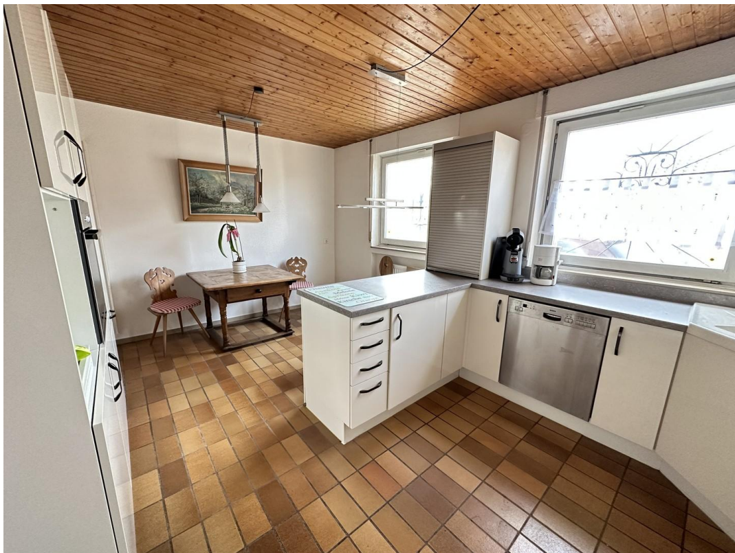
Küche mit Blick auf Essbereich