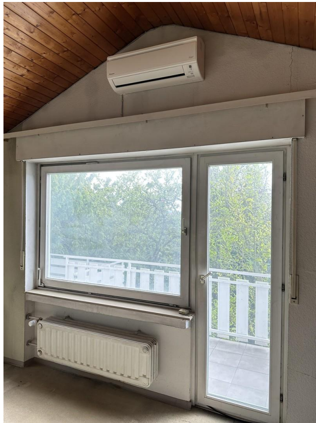
Schlafzimmer groß zum Balkon