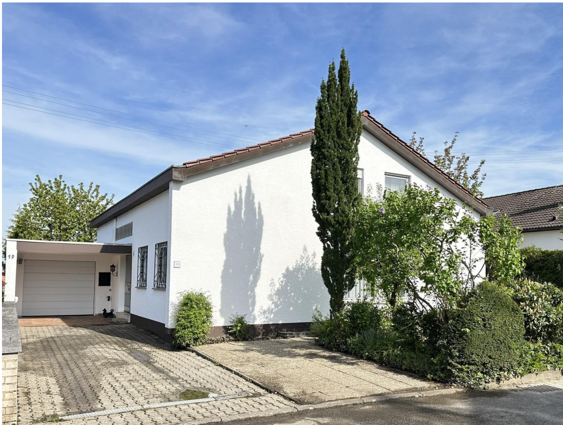
Haus Garage Eingang