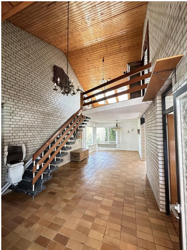
Eingang mit Blick auf Galerie