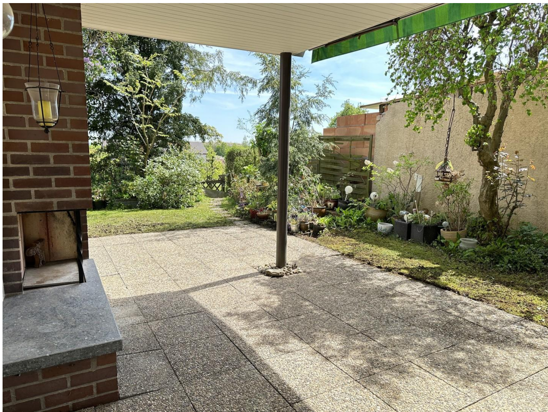
Terrasse teilweise überdacht