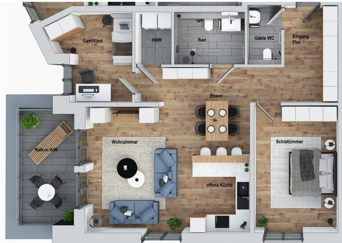
Grundriss Whg. № 5 im 1. OG