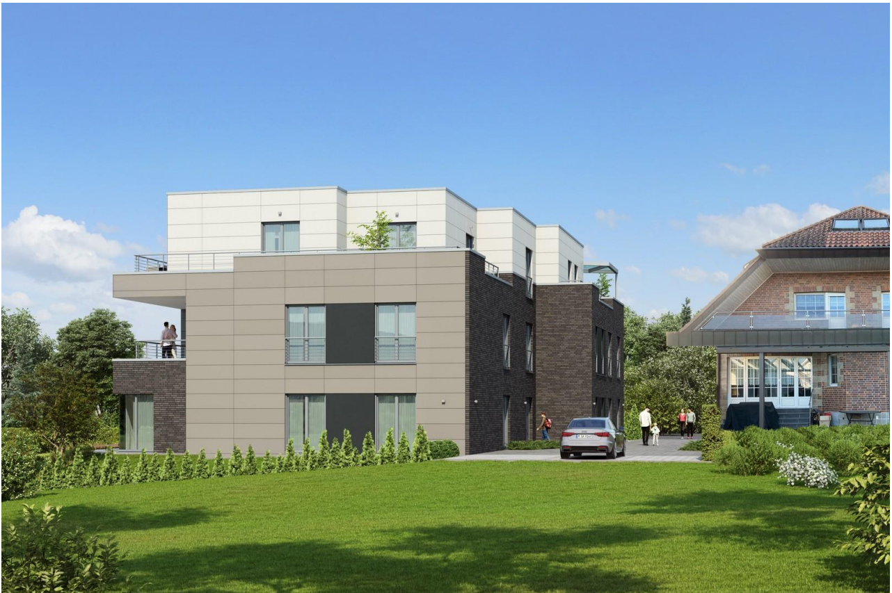
Nord-Ost Ansicht, Hauseingang