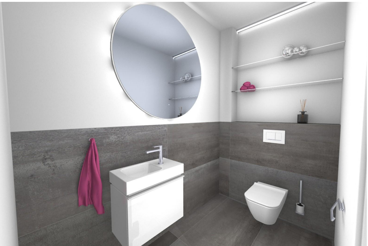
Ansicht Gäste WC