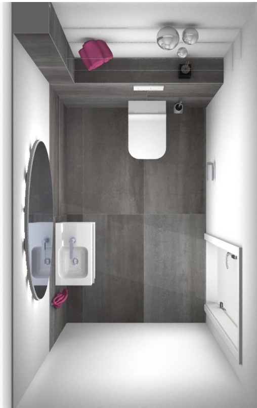
Grundriss Gäste WG