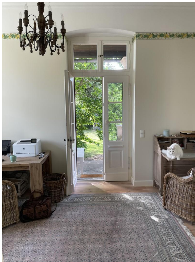
Arbeitszimmer mit Veranda