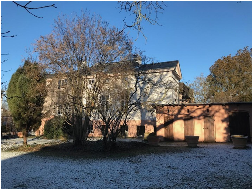
Villa mit Nebenglass