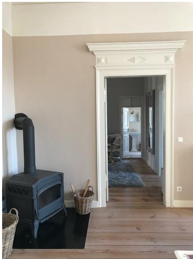
Wohnzimmer mit Kamin