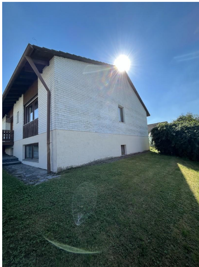
Blick von Norden