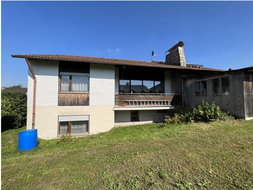
Ansicht von Westen