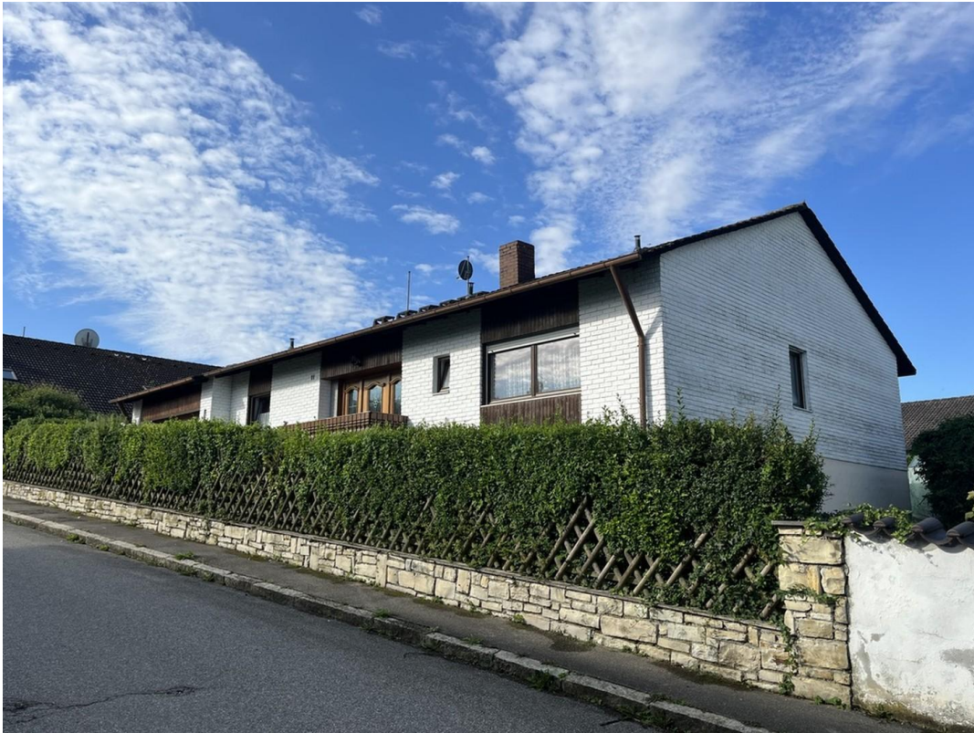
Ansicht von der Straße