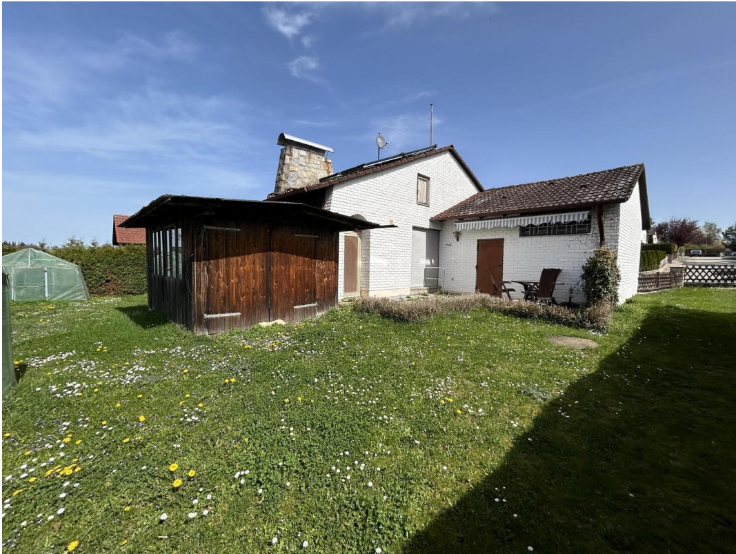
Garten Blick zur Terrasse