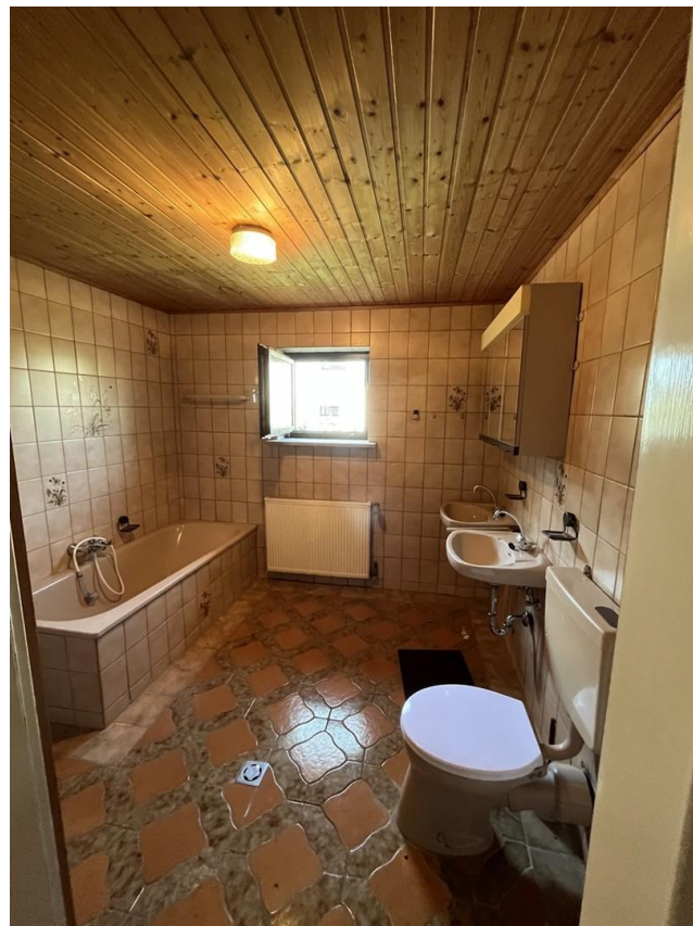
Bad im UG