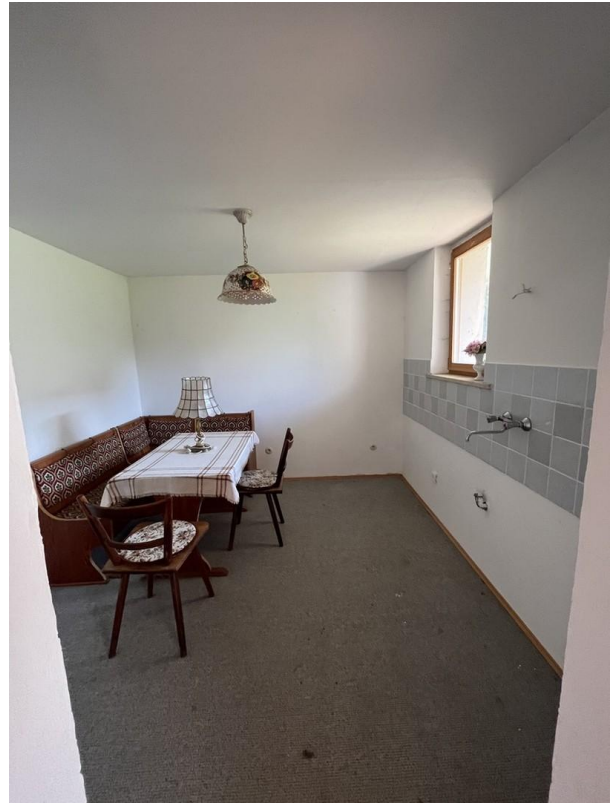
Raum mit Küchenanschlüssen UG