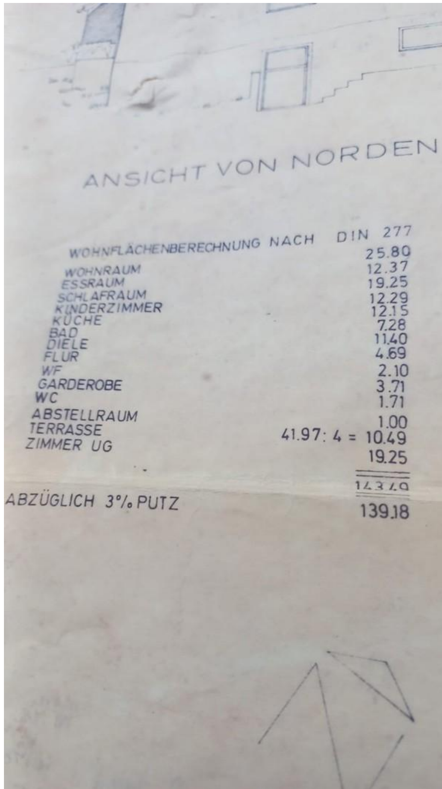
Wohnflächenberechnung - urspr.