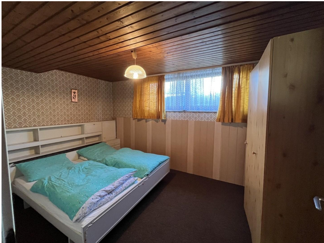
Schlafzimmer im UG