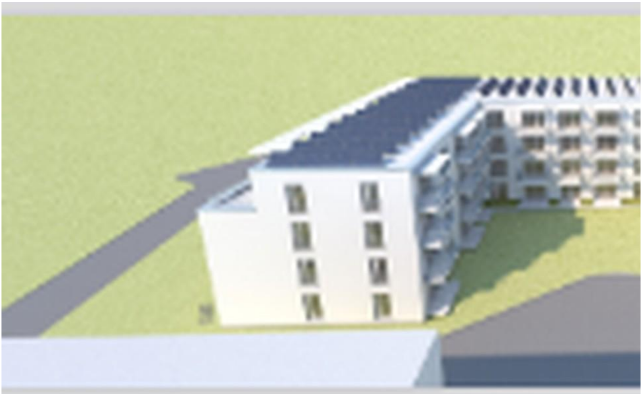
Blick aus Süd-Westen