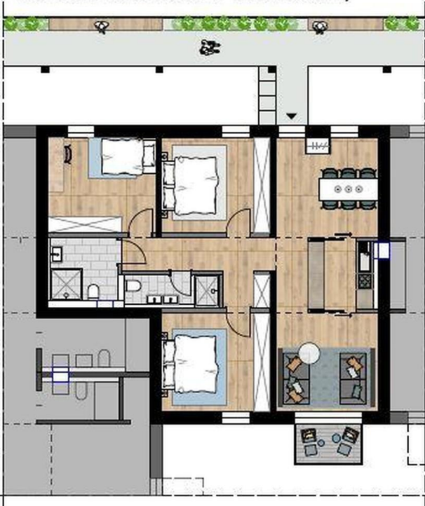
Typ a) "abtrennbare Küche" mit Bad 2)