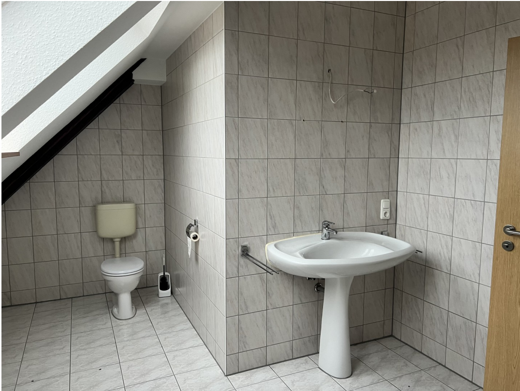
Bad / Dusche Obergeschoss