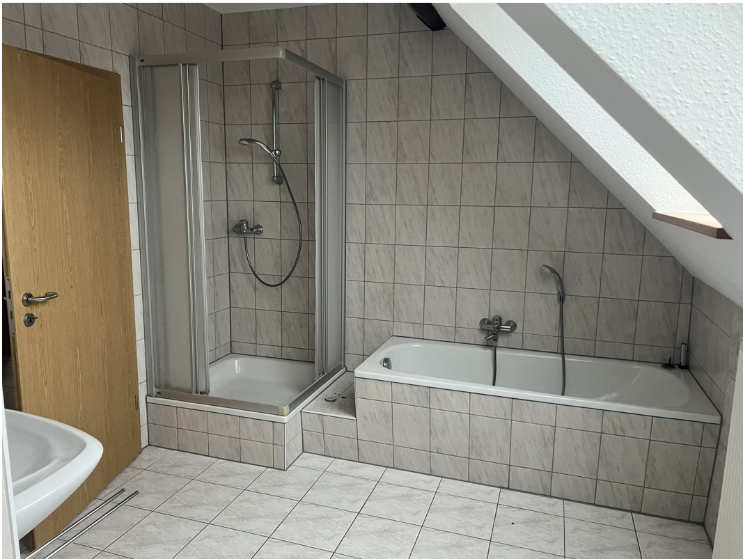
Bad / Dusche Obergeschoss