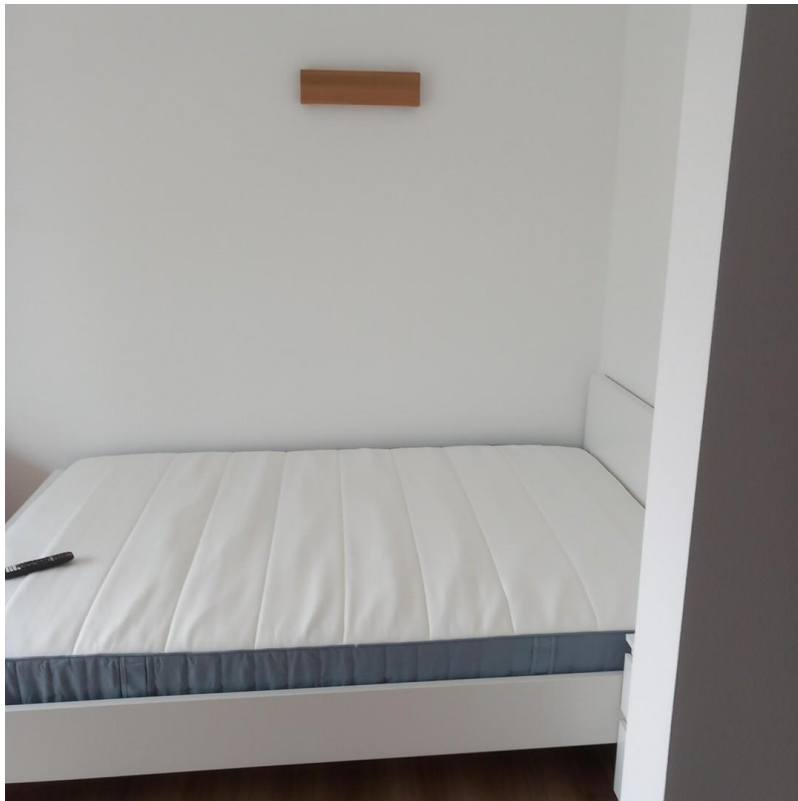
140 cm breites Bett