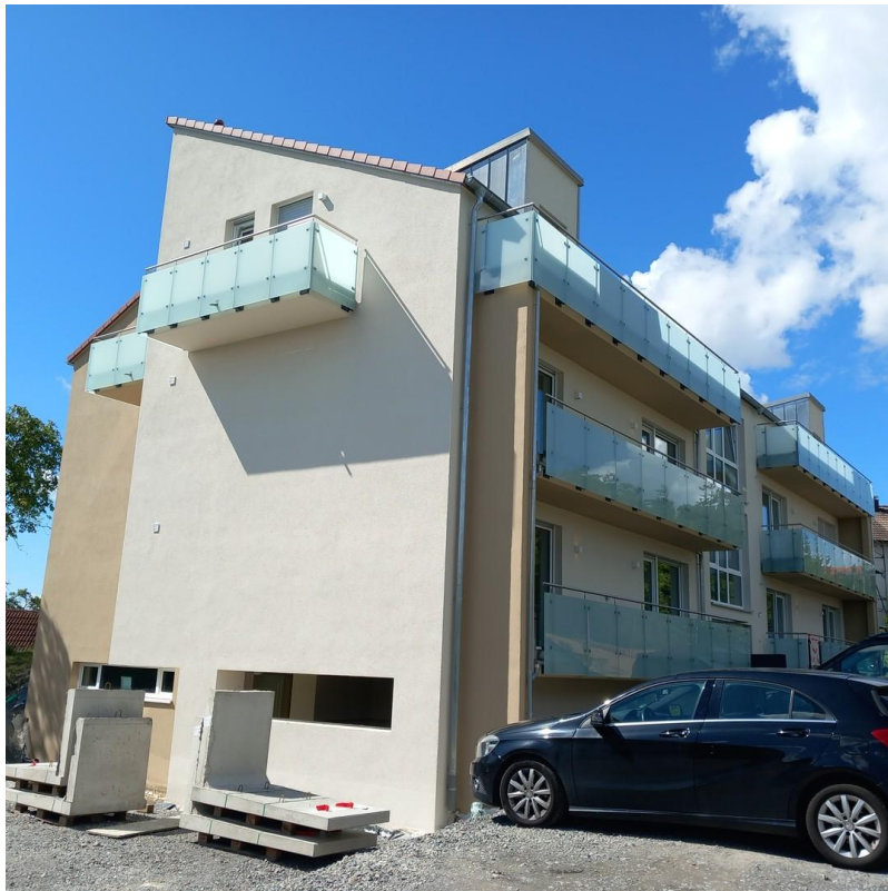
Neubau in Gaisbach