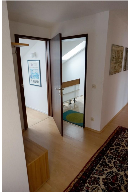
Flur mit Eingangstür