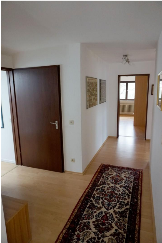
Flur mit Eingangsbereich