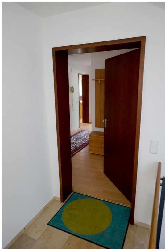
Eingang zur Wohnung