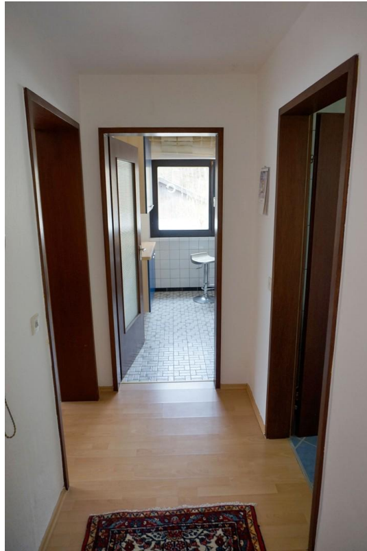
Flur mit Blick in Küche