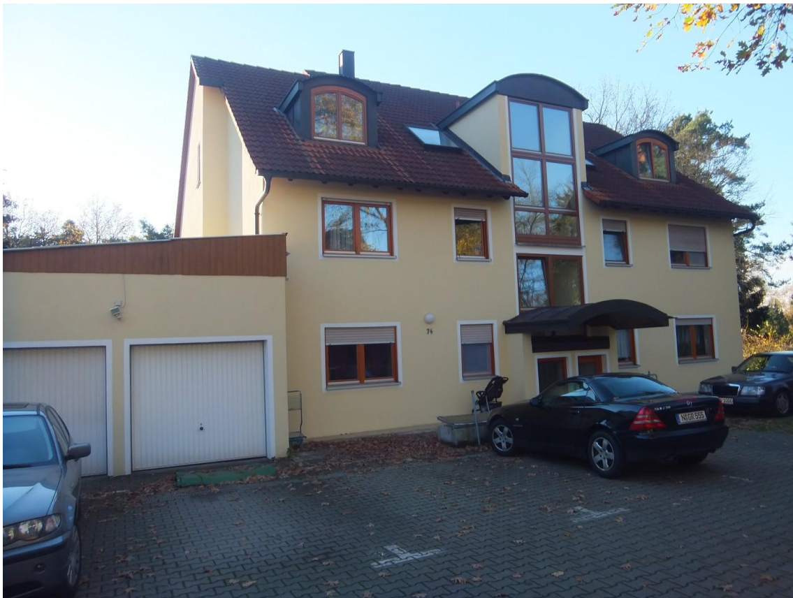
Whg. oben links, Garage rechts