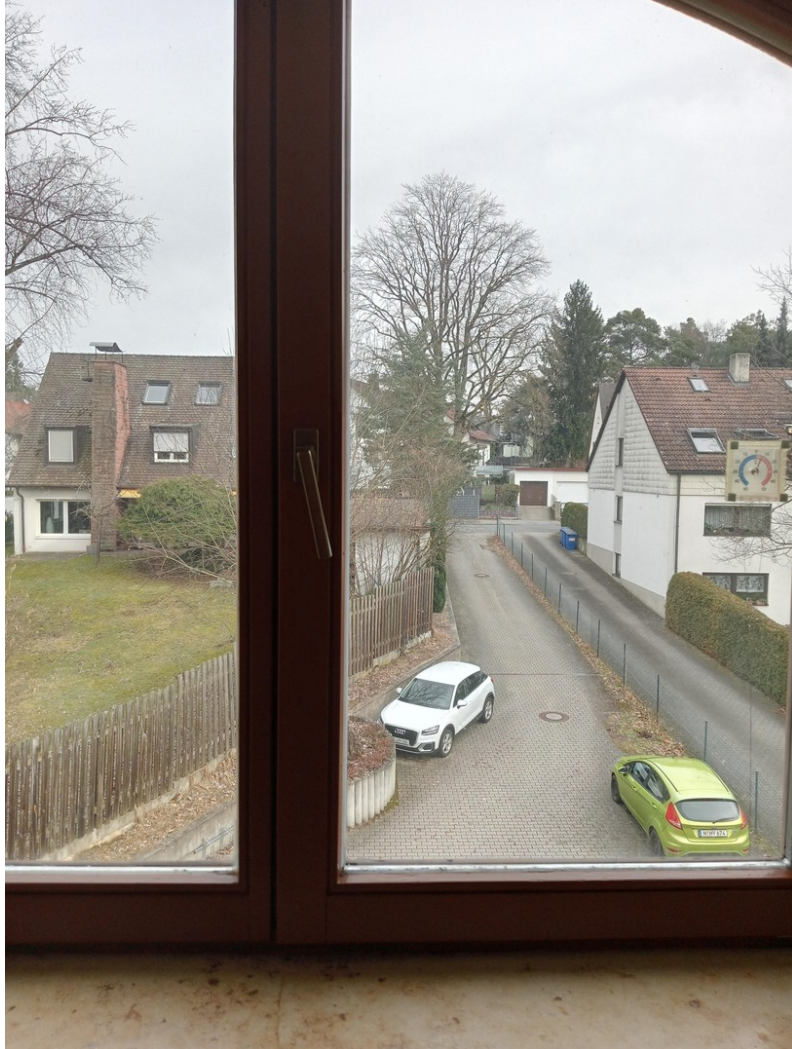
Blick zur Nordseite u. Anfahrt