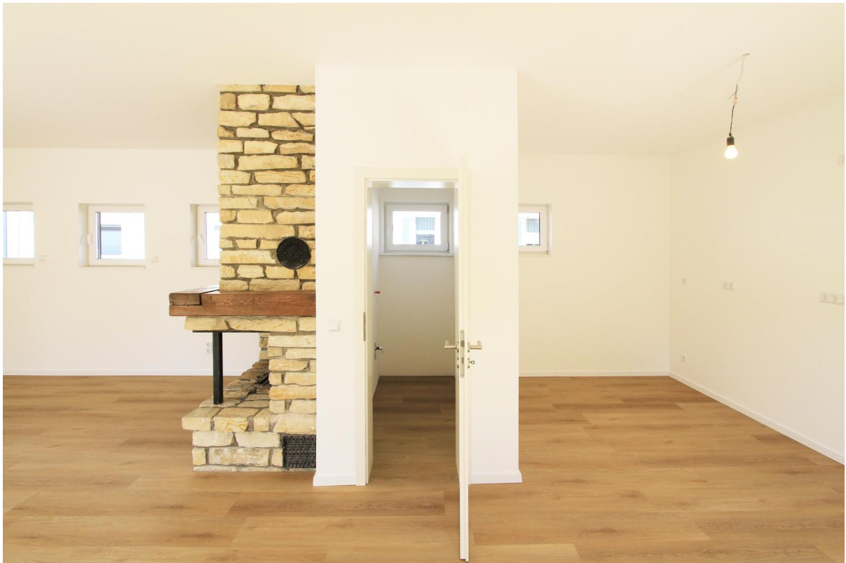
Übergang Küche mit Vorratsraum