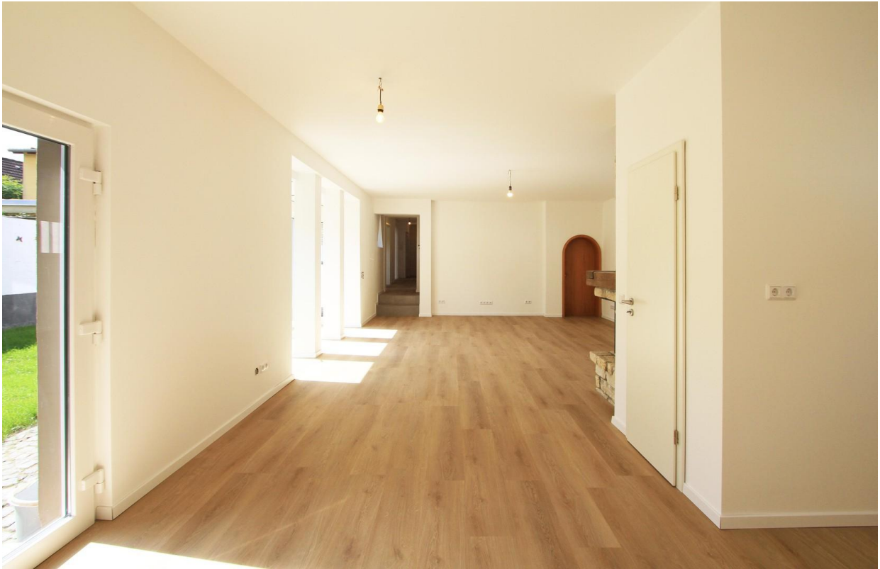
Blick aus der Küche