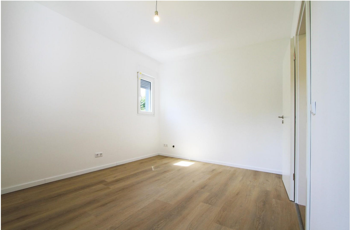
Schlafen 3 oder Büro