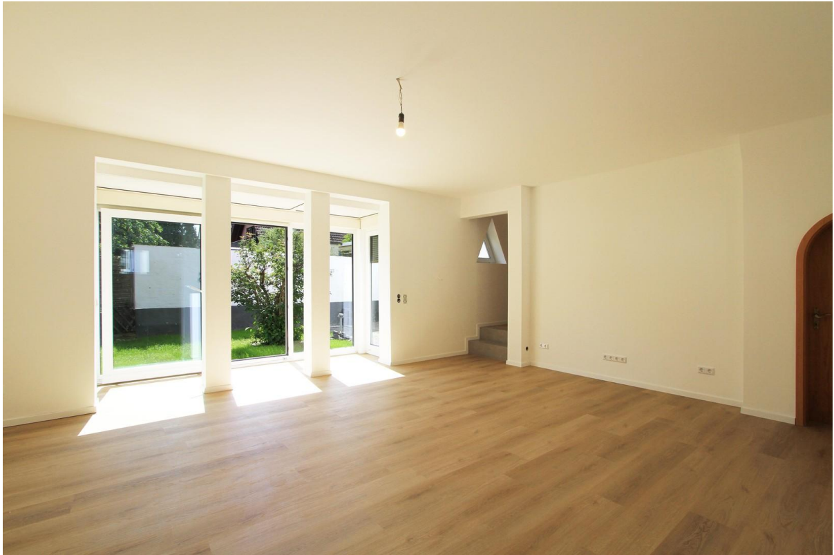
Blick ins Grüne