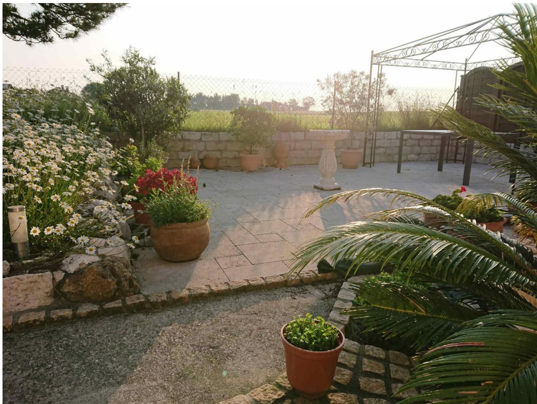
Terrasse-Blick aus Küche 1.OG