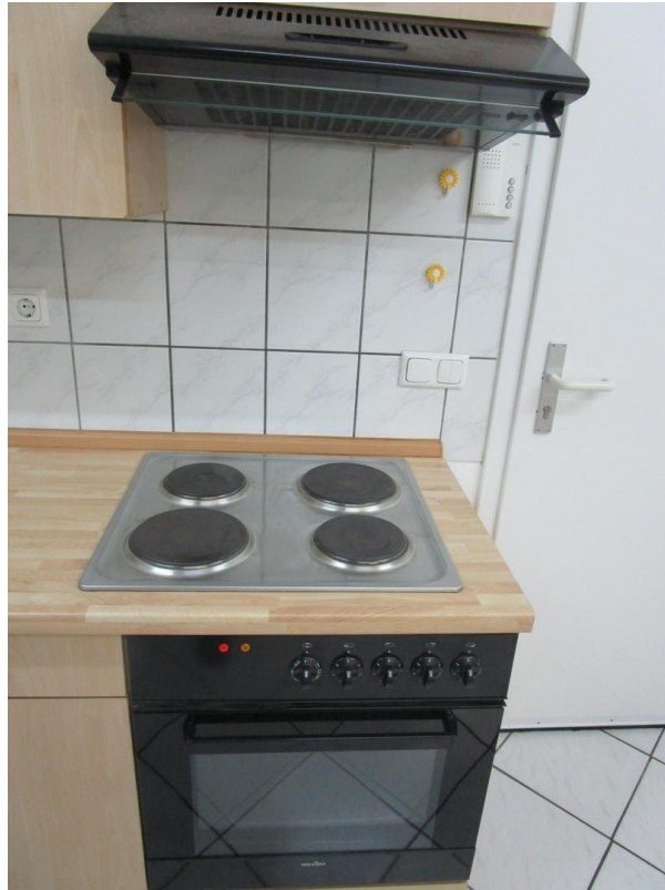
Herd mit Backofen