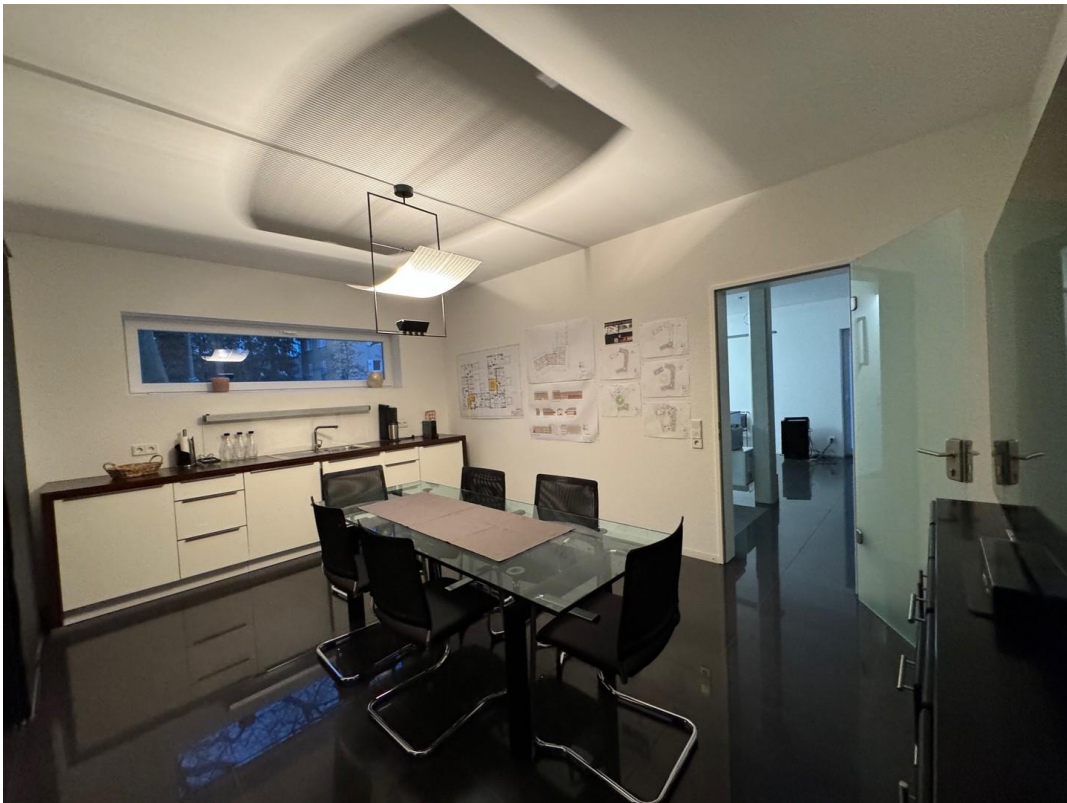
Konferenzraum mit Pantry