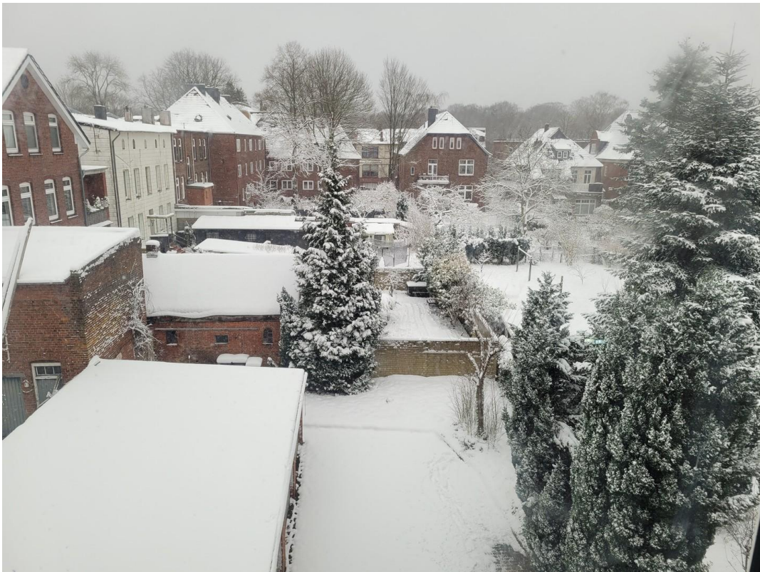
Ausblick Küche und Schlafzimmer