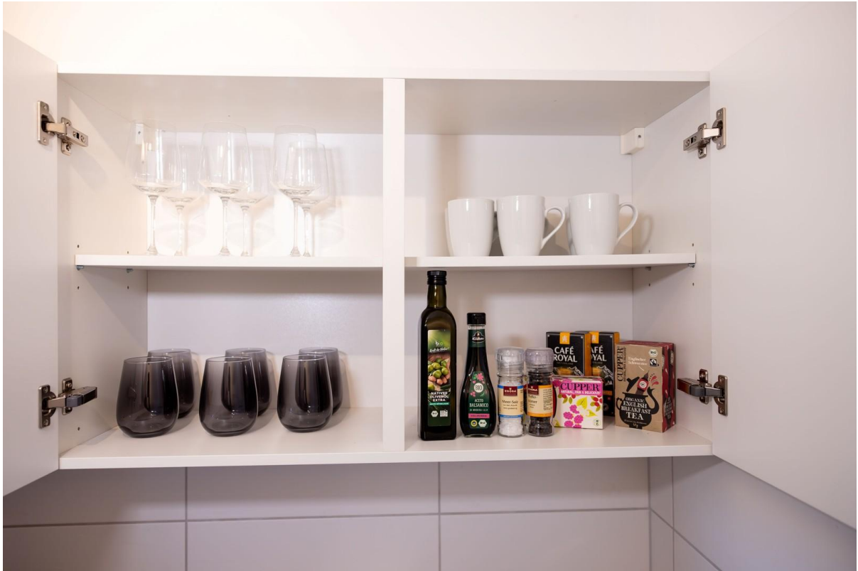
Küche voll ausgestattet