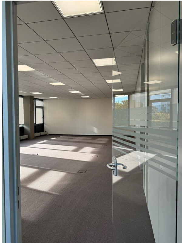
Blick ins Großraumbüro