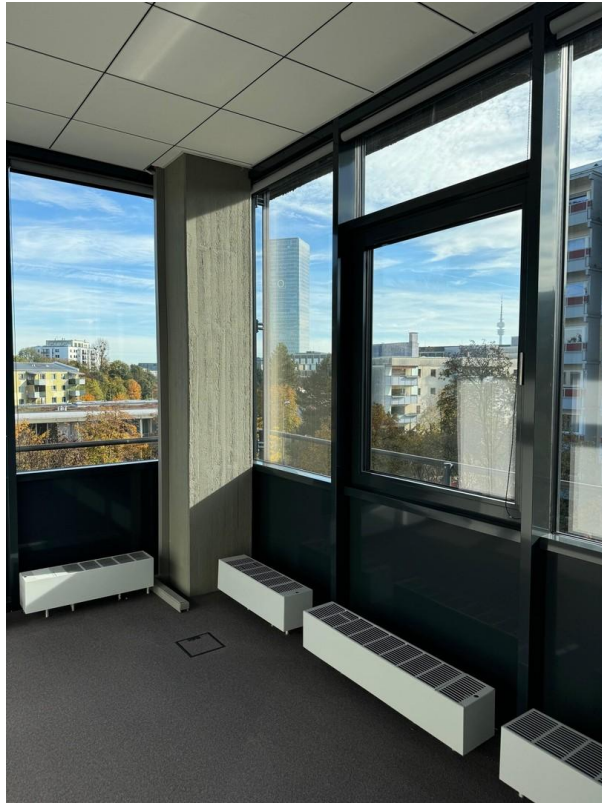
Büro mit Blick Olympiaturm