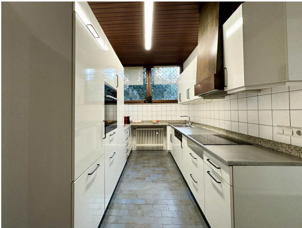
Küche, komplett eingerichtet