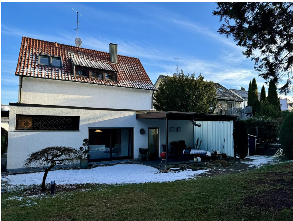
Außenanlage & Terrasse hinten