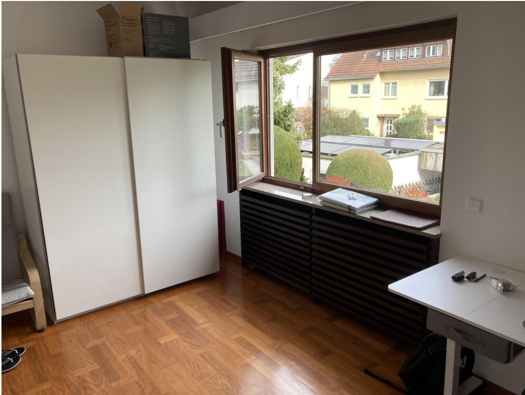
EG li, 16 m 2 , 670 €