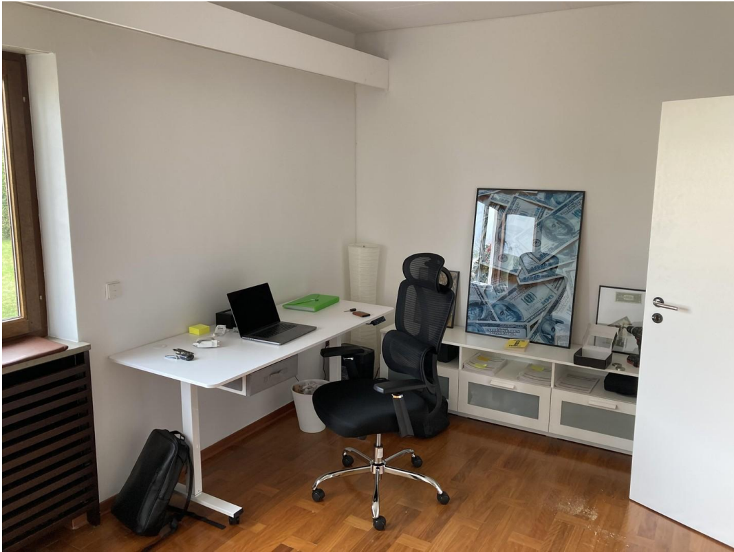
EG li, 16 m 2 , 670 €