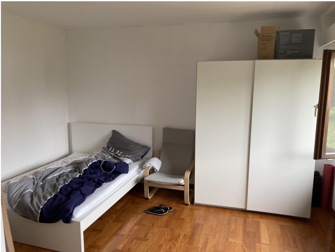
EG li, 16 m 2 , 670 €