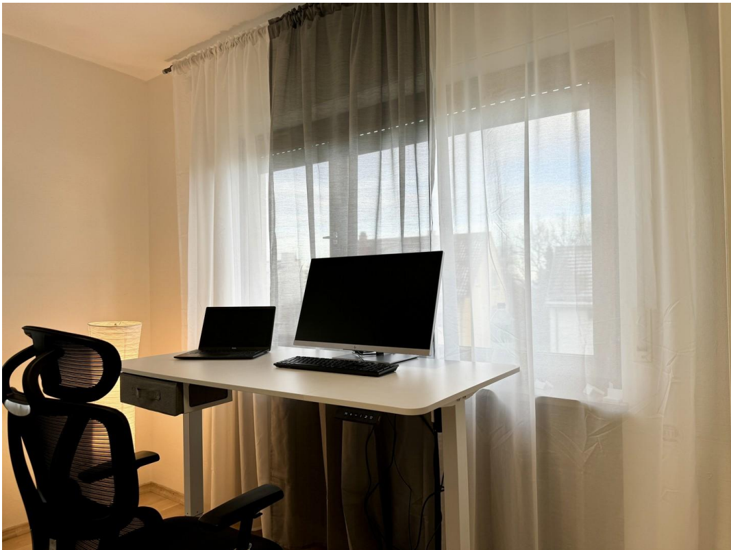
Tisch (höhenvers.) & Bürostuhl