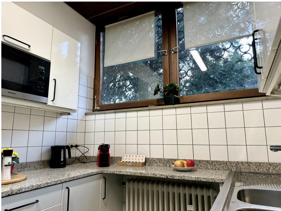
Küche, alle Geräte