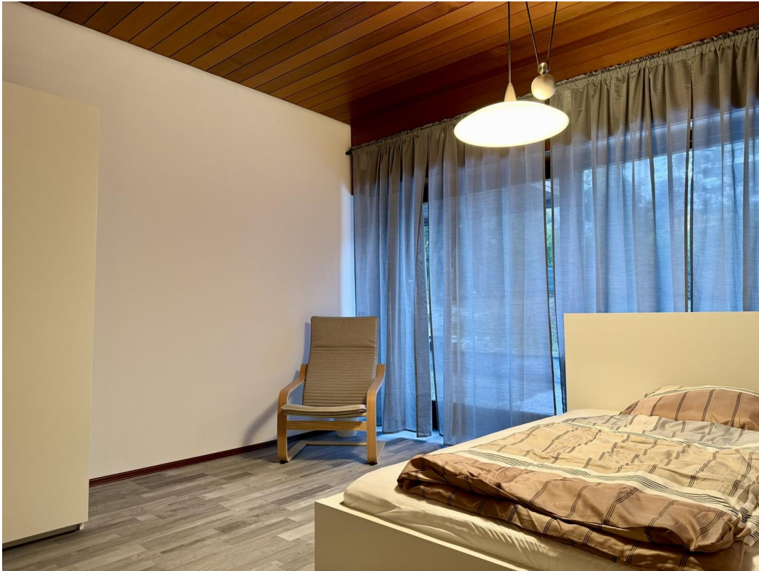
EG re, 16 m 2 , 690 €