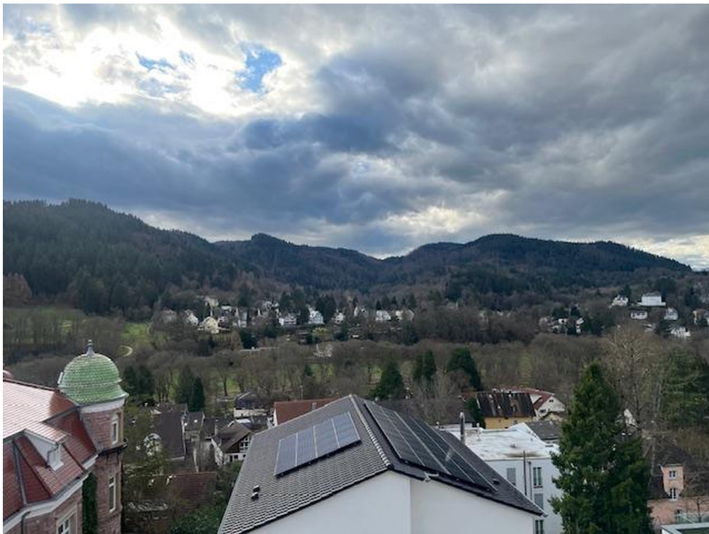
Aussicht vom Balkon