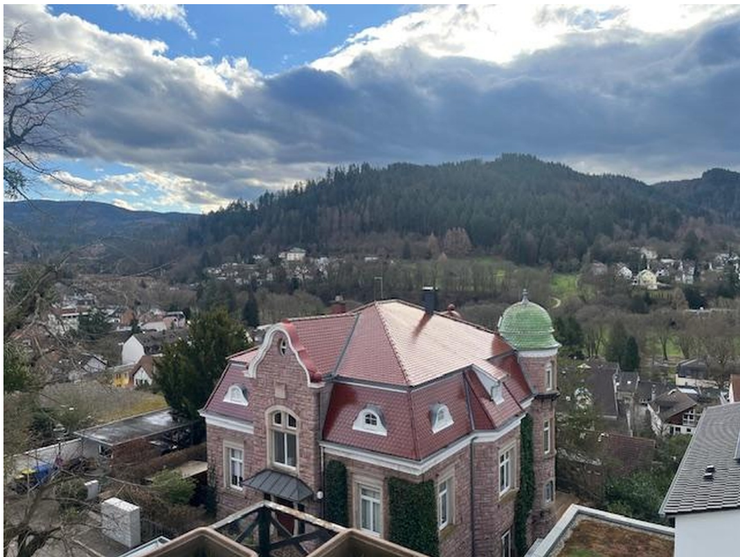
Aussicht vom Balkon