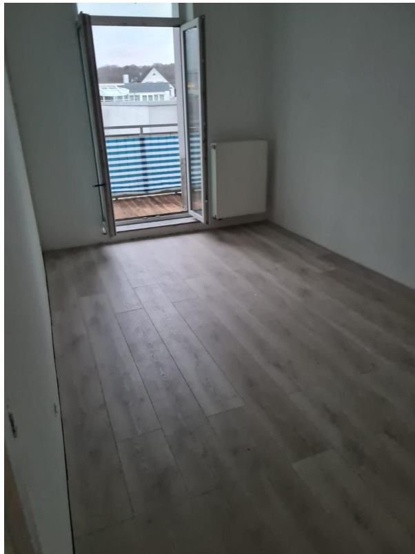
Zimmer 2 / Schlafen