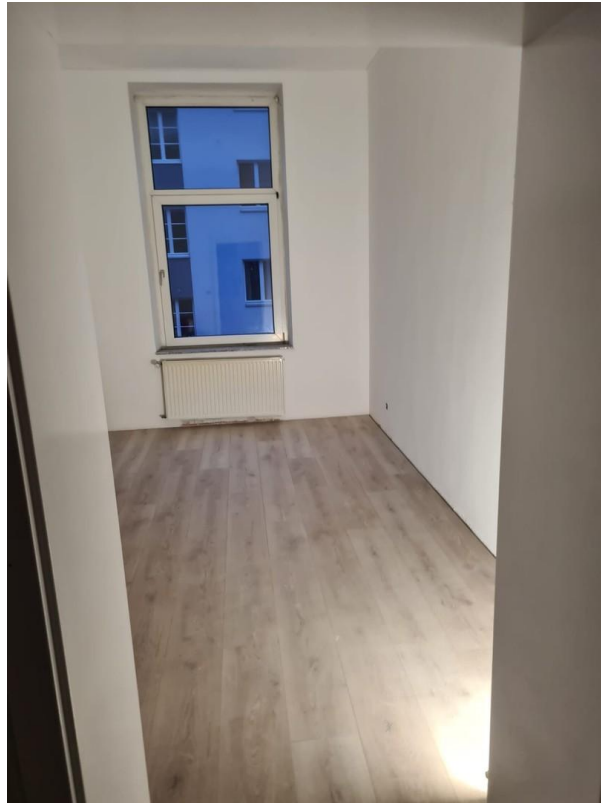
Zimmer 1 / Kind