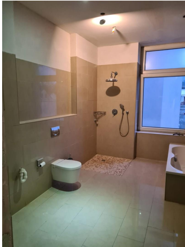
Bad mit bodentiefer Dusche