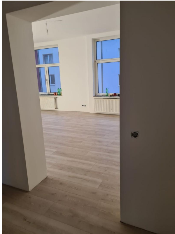
Blick ins Wohn/Esszimmer