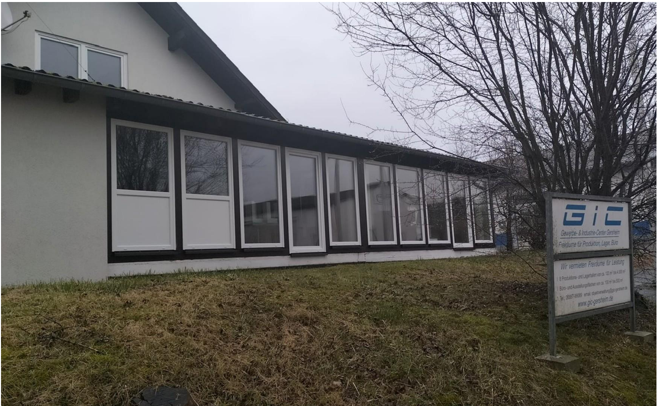
Büros nach Fenster-Austausch