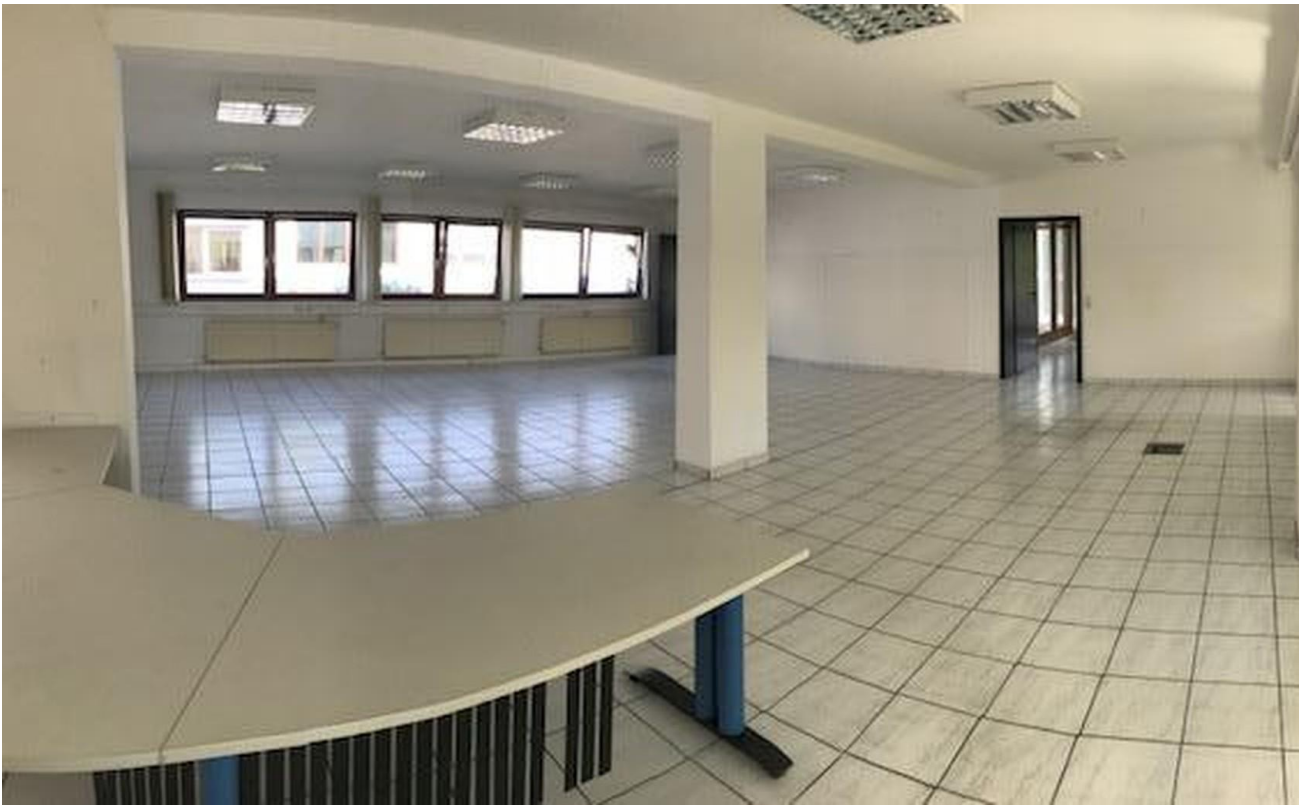
Eingangsbereich Büro EG