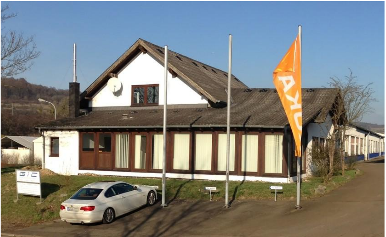
Standort vor Fenster-Austausch