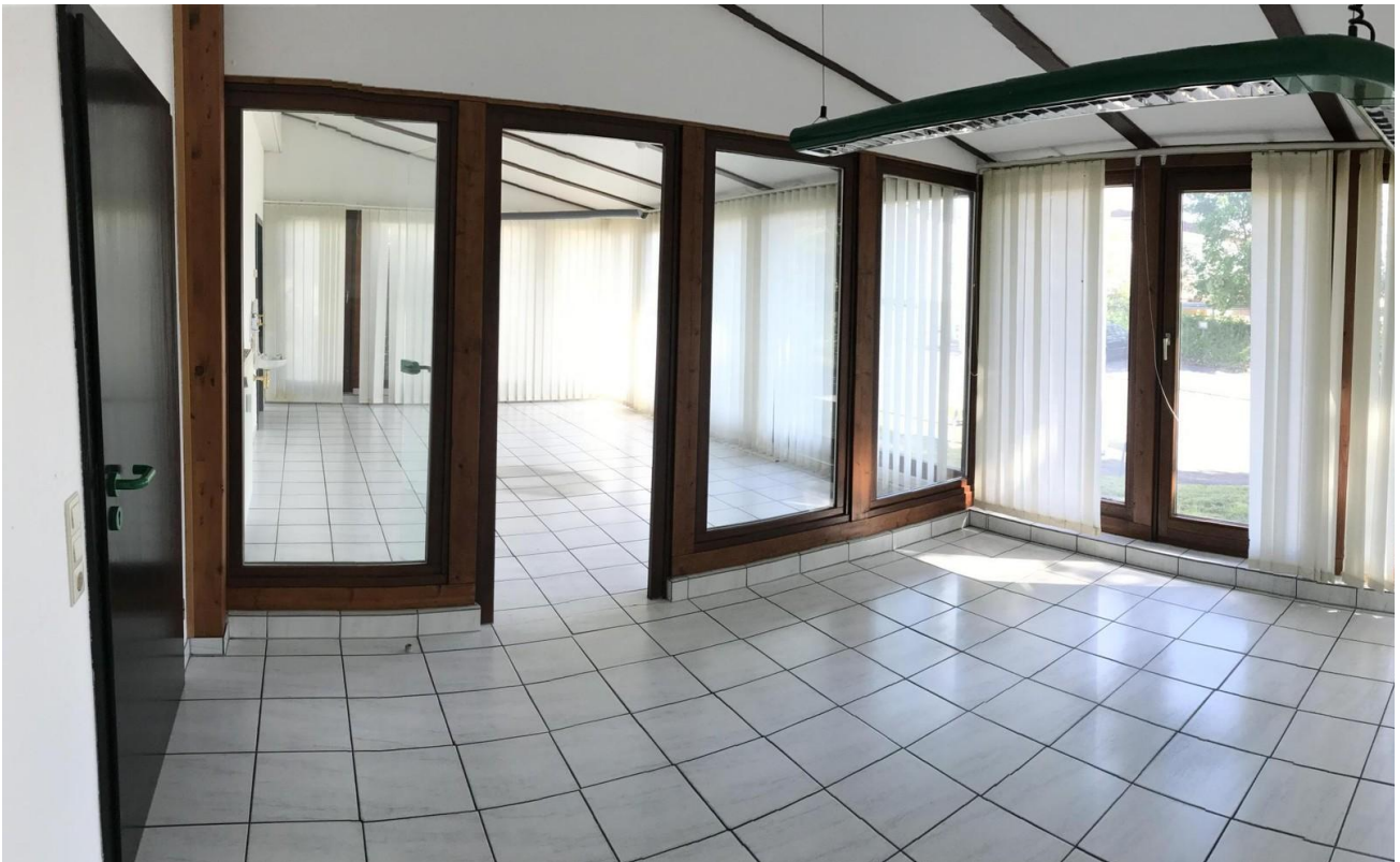
Wintergarten mit Klima, Südw.