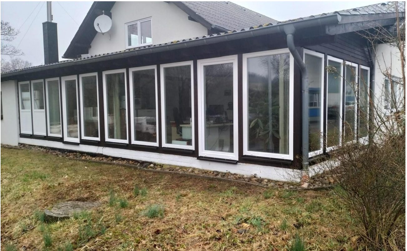
Büros nach Fenster-Austausch