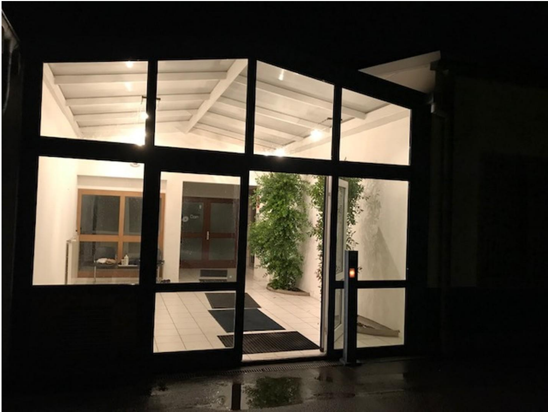
Foyer bei Nacht