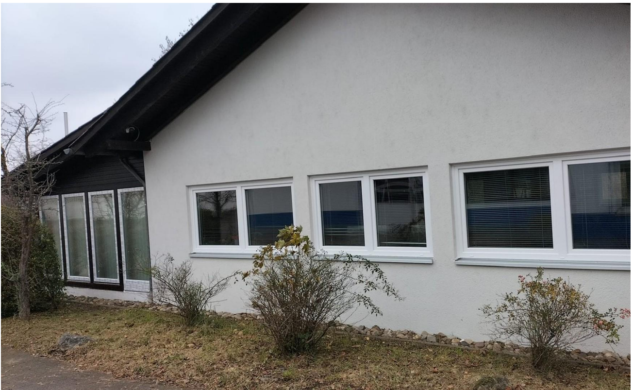
Büros nach Fenster-Austausch