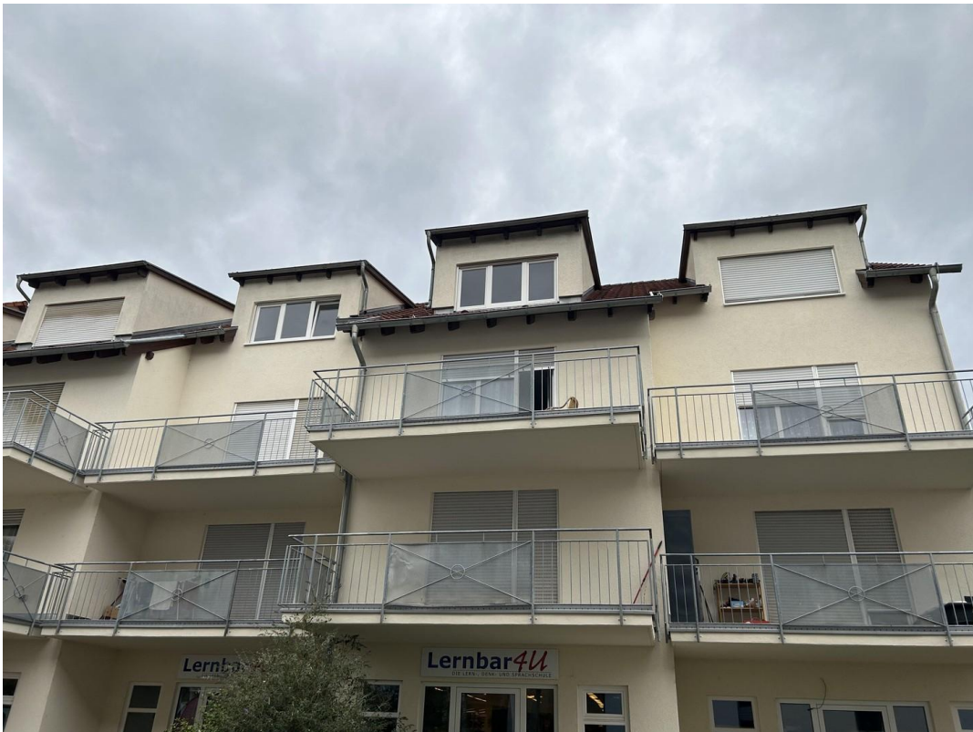
Außen 3 - Mitte oben