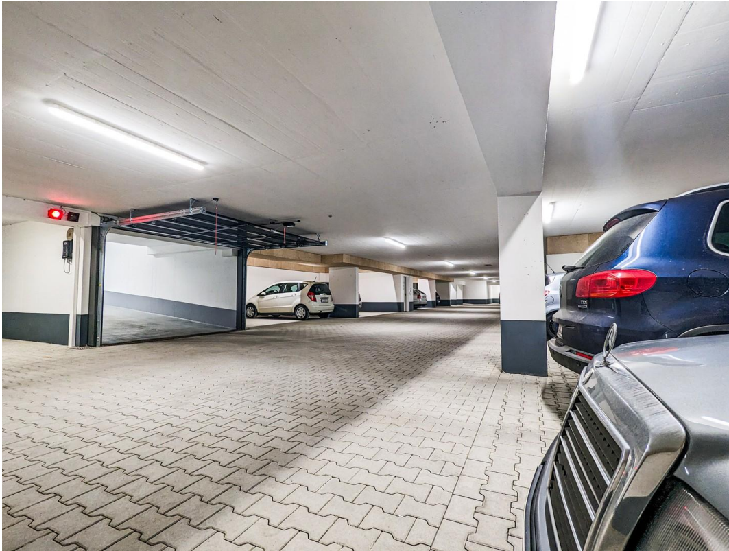
Beispiel TG (Berkheim)