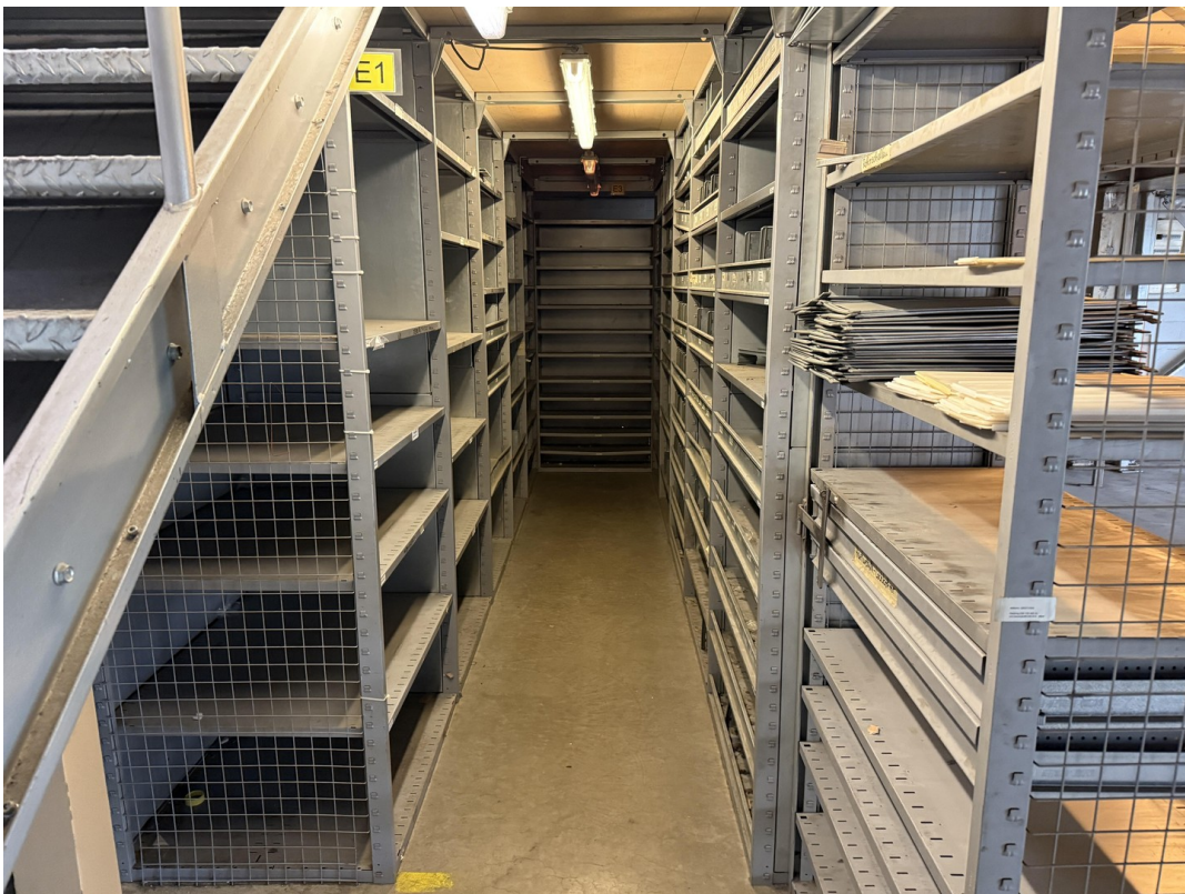
Archiv / Lager