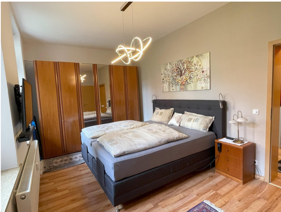
Schlafzimmer mit Bett/Schrank