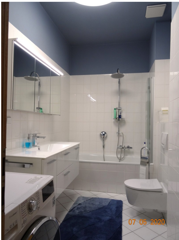
Bad mit Waschtrockner