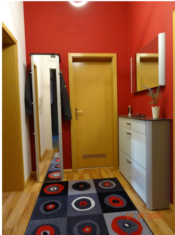
Flur Richtung Bad