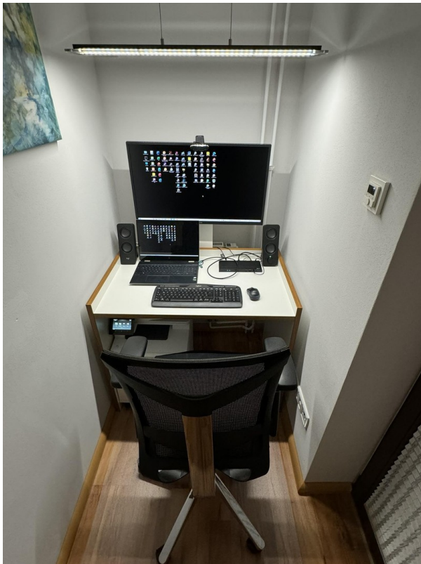
Schlafzimmernische mit Büro