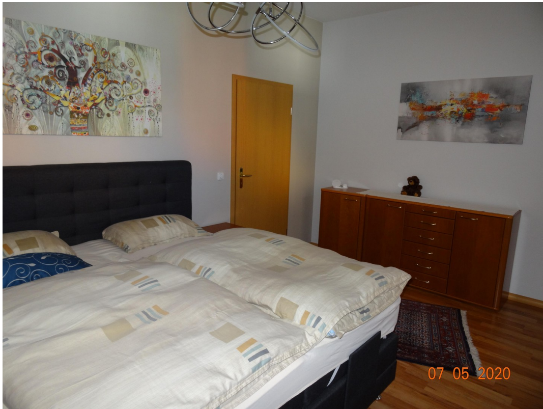
Schlafzimmer mit Bett/Kommode