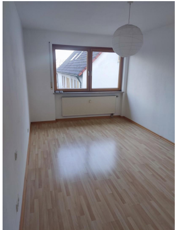
Arbeiten - Schlafen