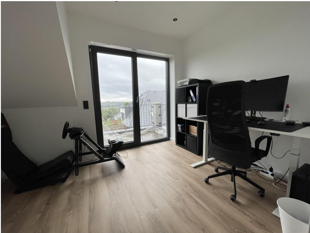
Büro / Kinderzimmer