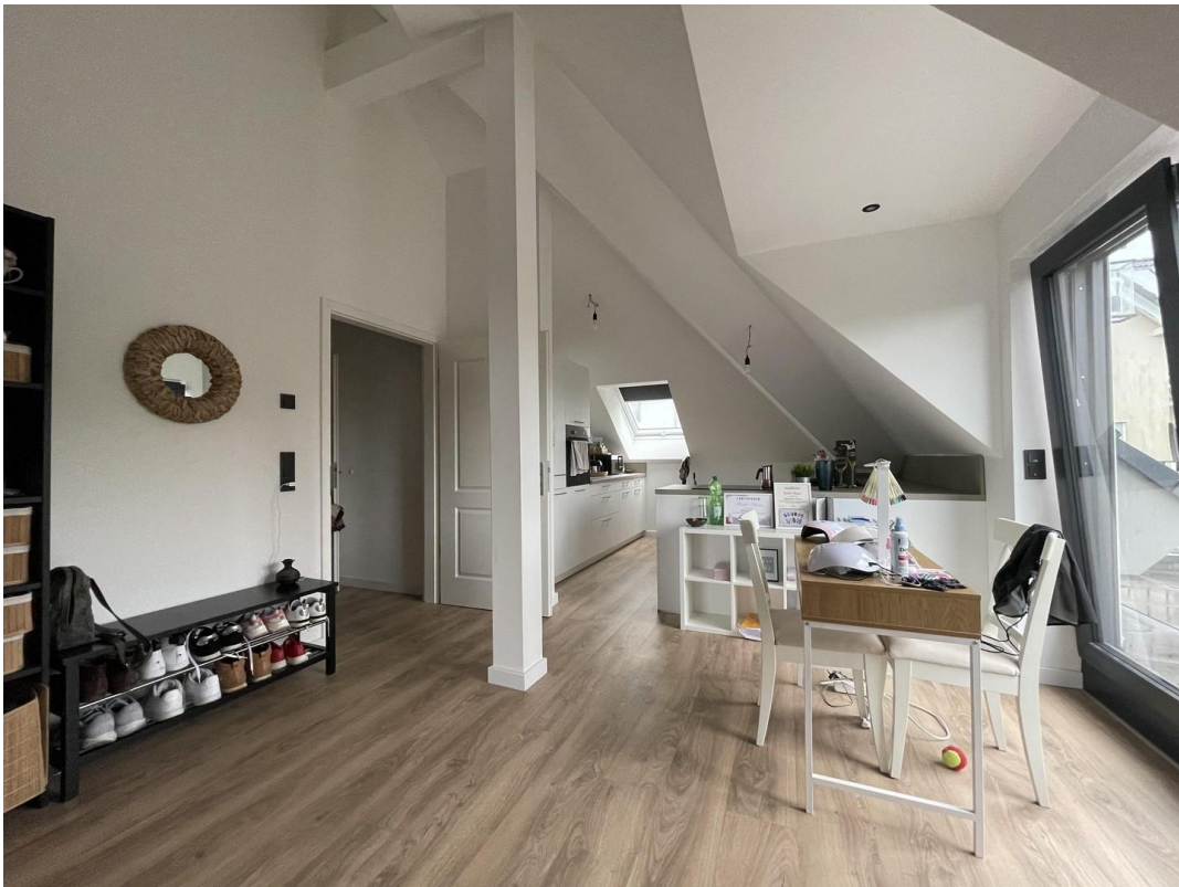
Offene Küche / Essbereich