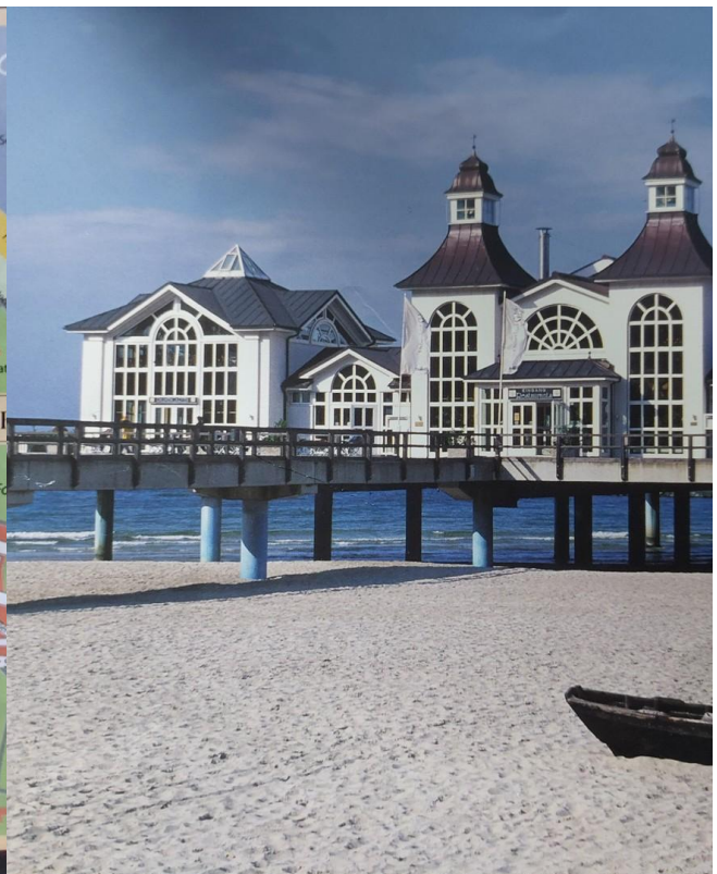
Seebücke in Sellin