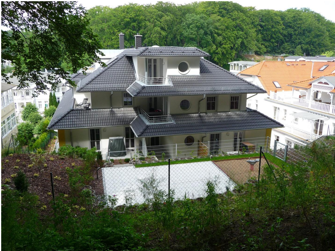
Das Haus von hinten