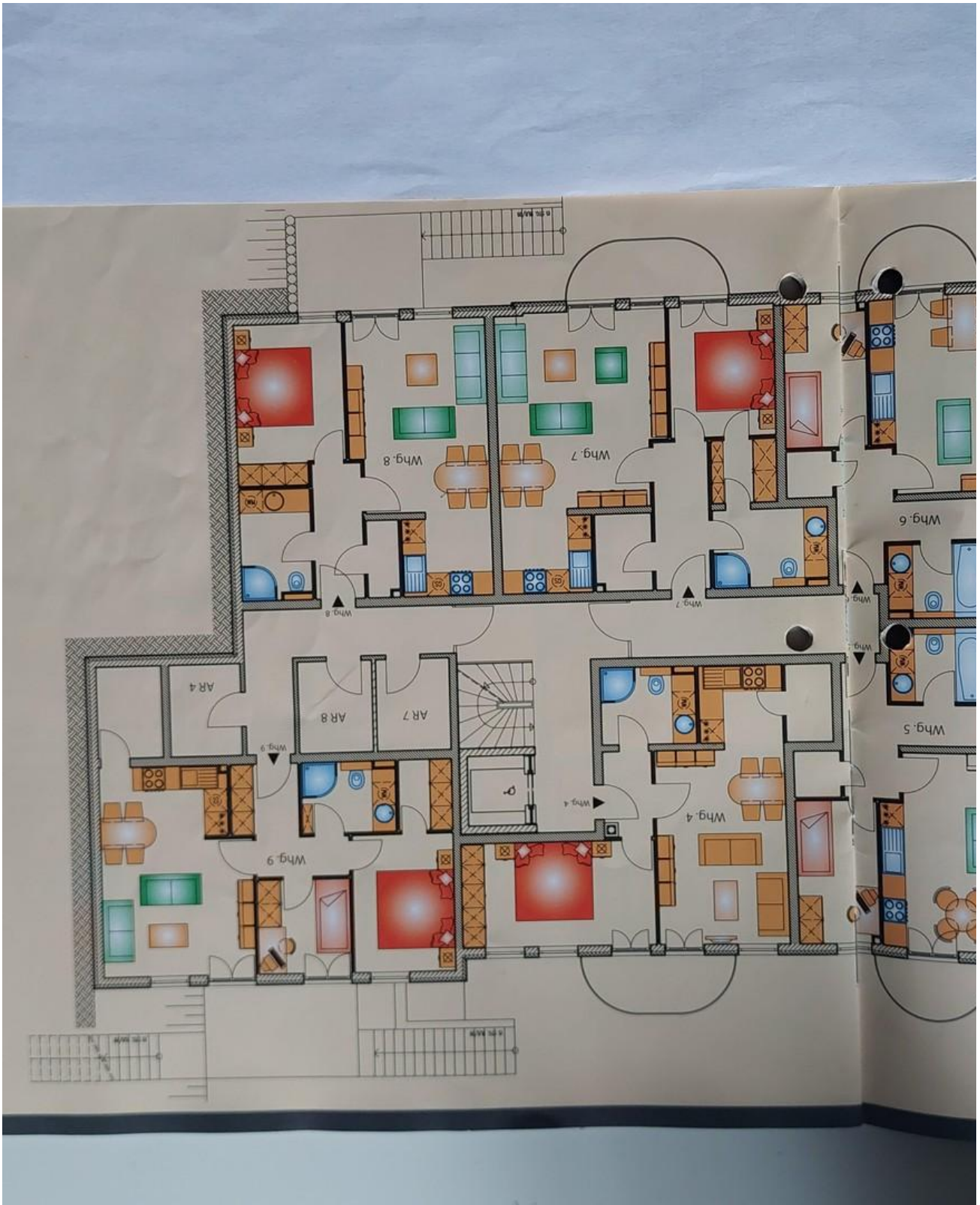
Grundriss - Erste Etage