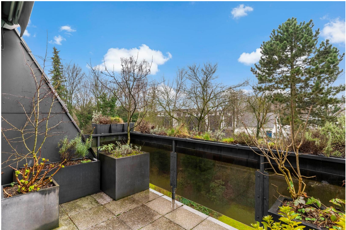
Balkon mit Blick ins Grüne