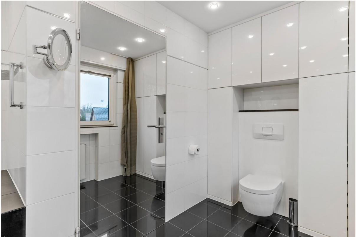
Badausstattung mit vielen Extra