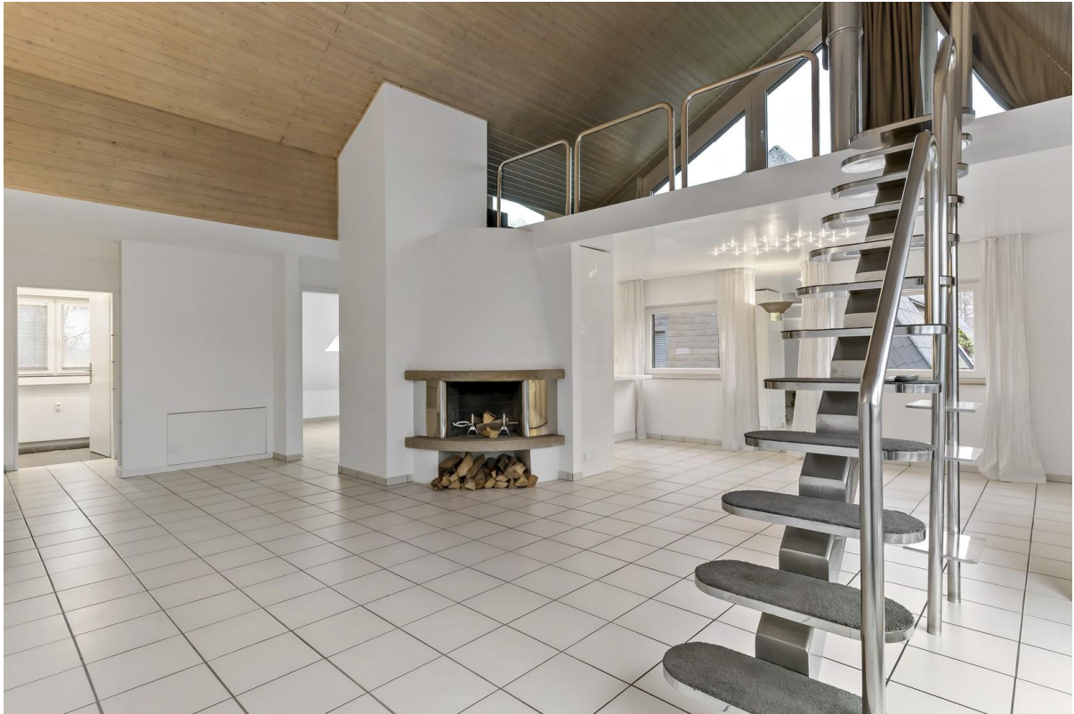
Wohnzimmer mit Blick zum Kamin