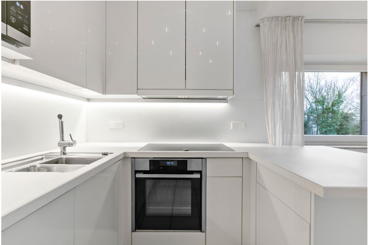
hochwertige Einbauküche Detail