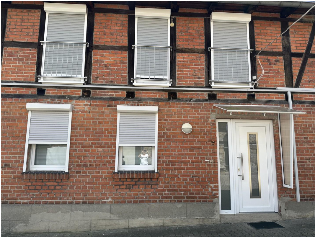
Wohnungszugang vom Hof