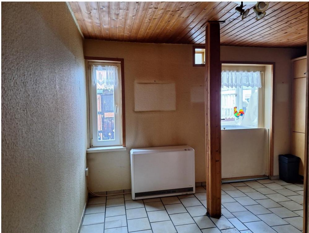
Küche und Ausgang zum Innenhof