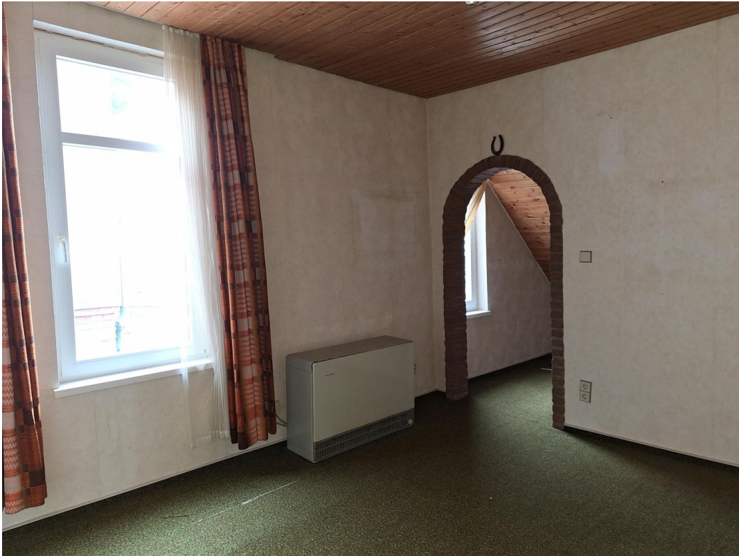
2. Kinderspielzimmer 1. Etage