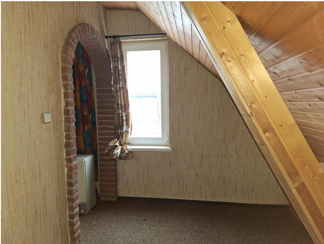
1. Kinderschlafzimmer 1. Etage