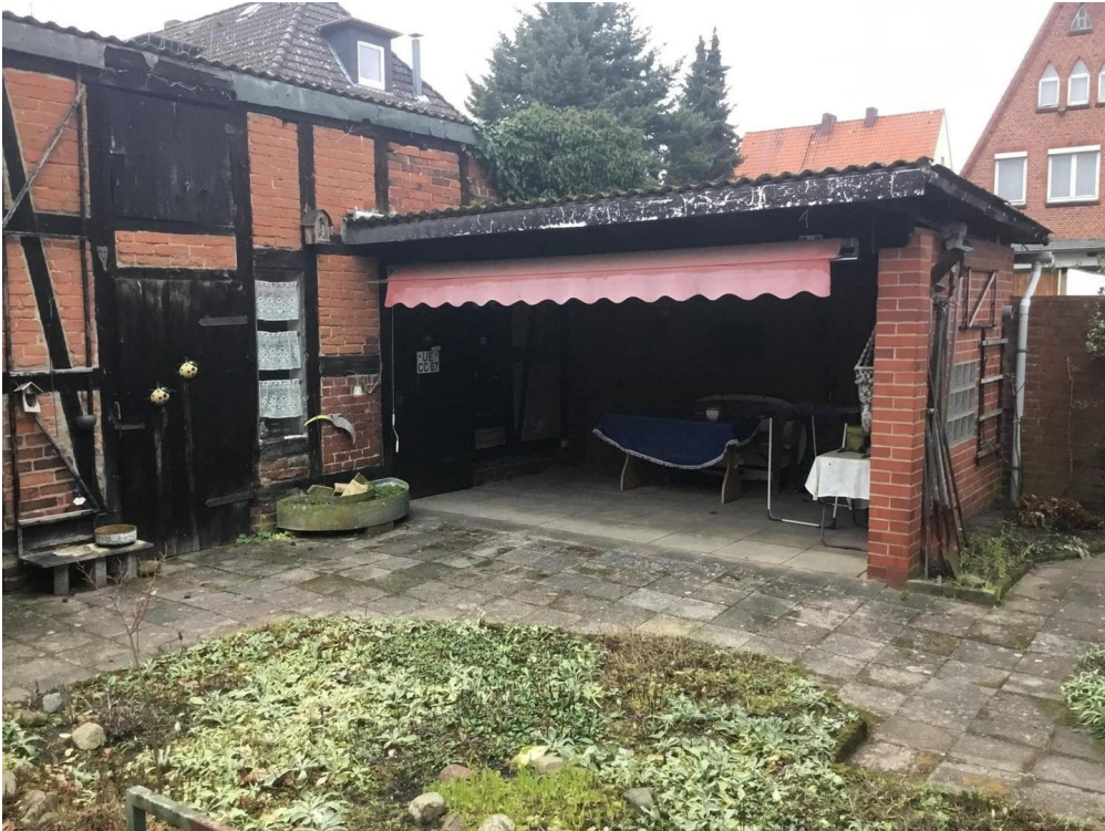
Werkstatt und Freisitz