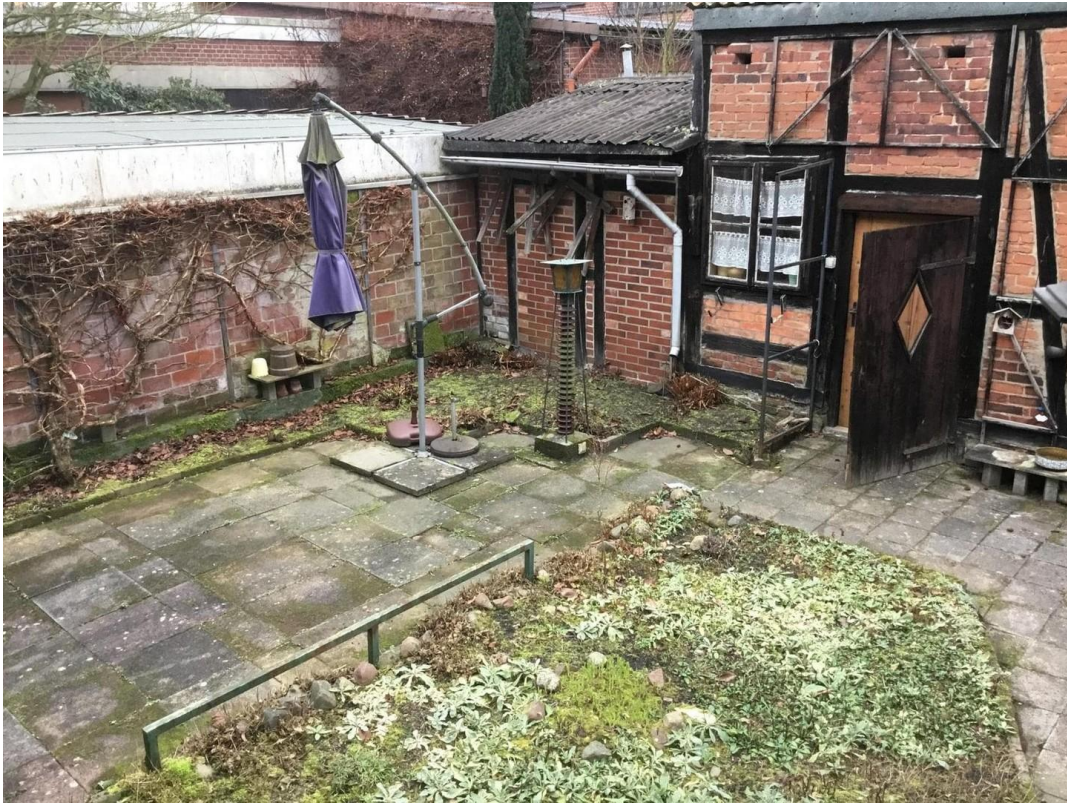
Partyraum und Sauna