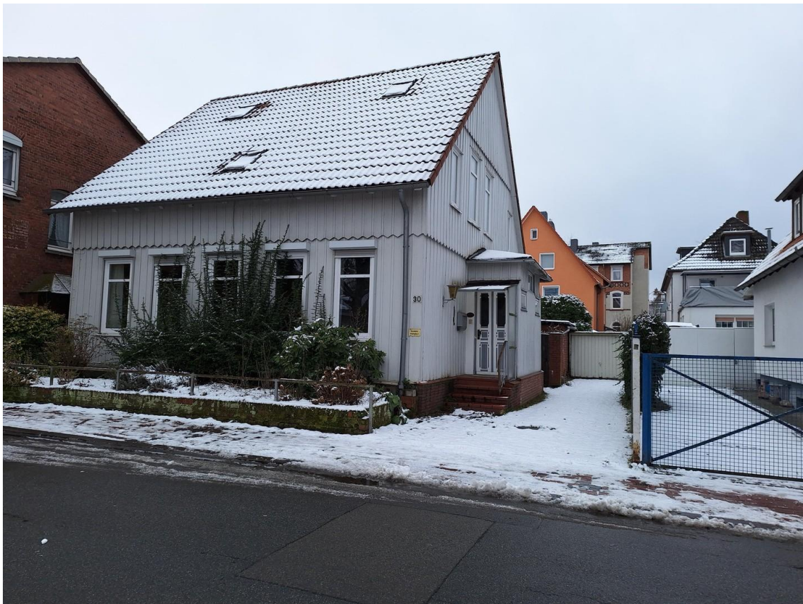
Außenansicht mit Garage