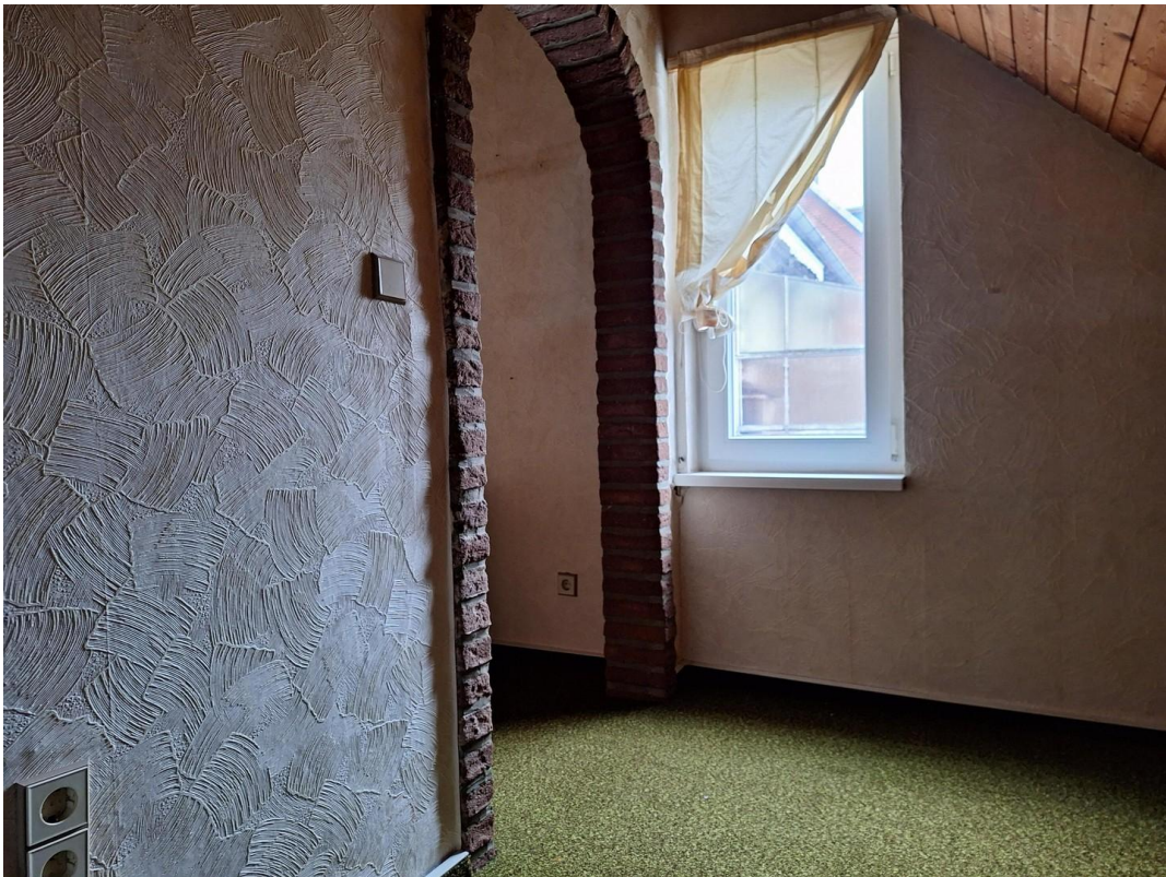
2. Kinderschlafzimmer 1. Etage