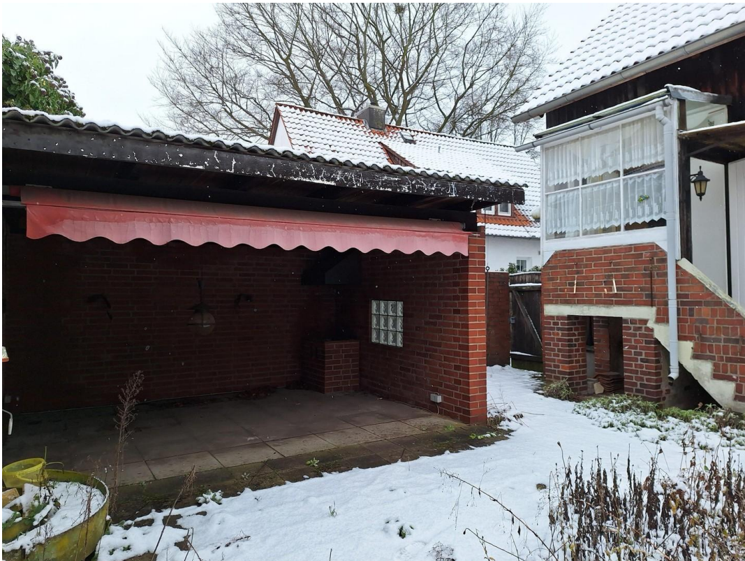
Ausgang Küche und Freisitz