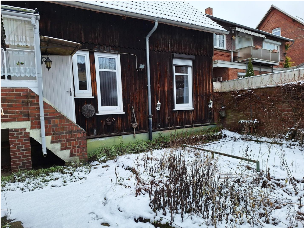
Außenansicht vom Garten