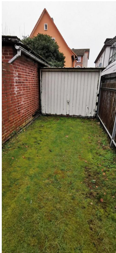
Garage und Stellplatz