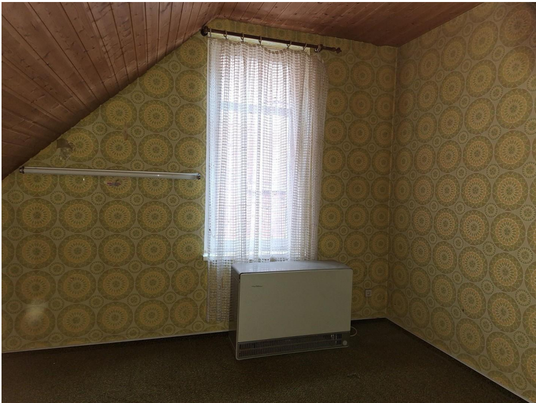
Büro 1. Etage