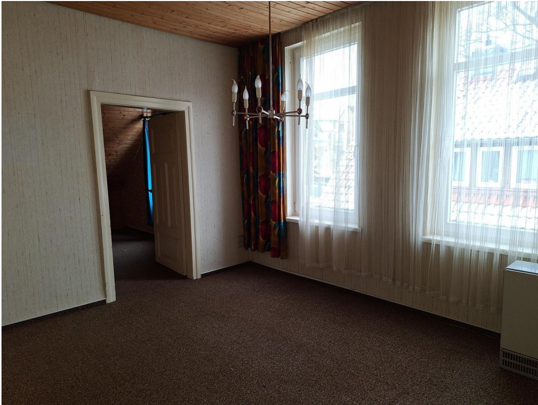
1. Kinderspielzimmer 1. Etage