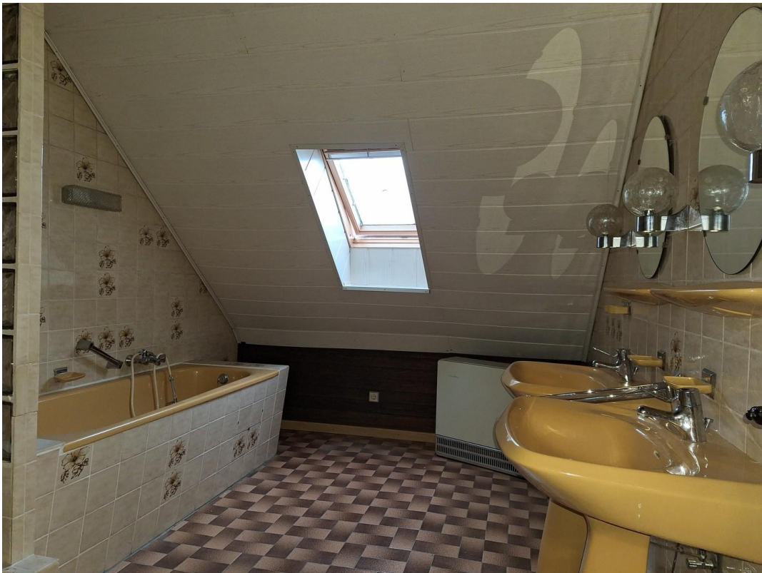
Bad 1. Etage