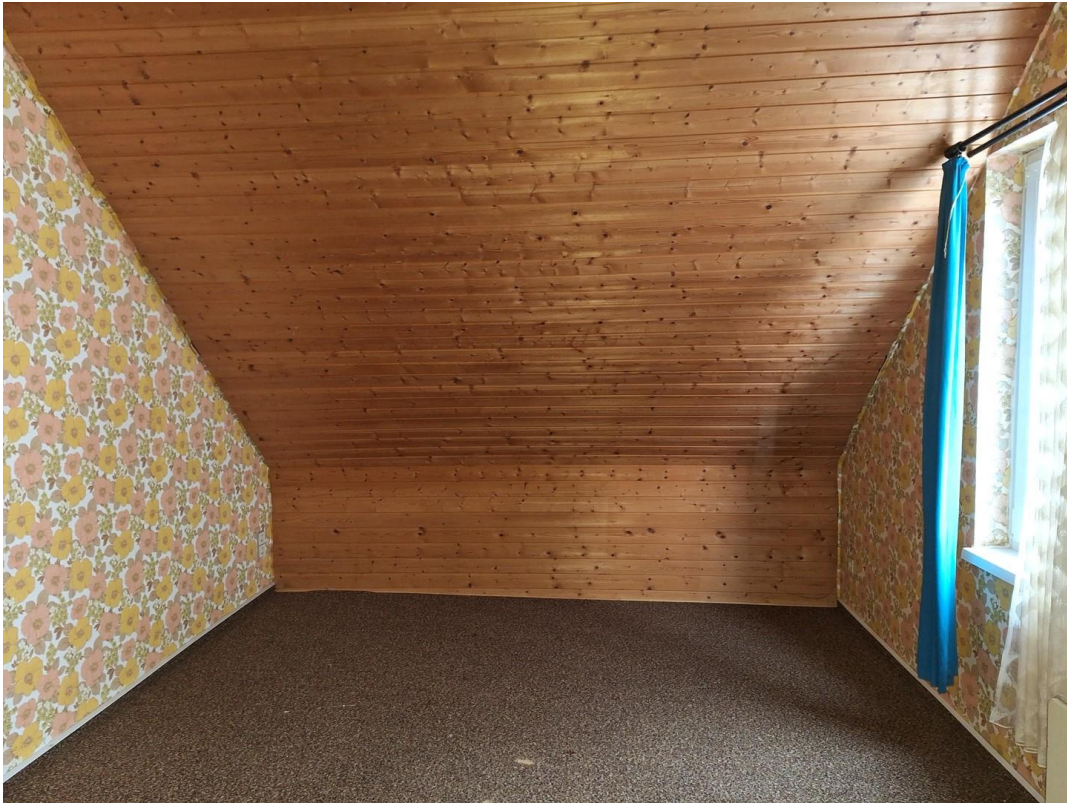
Büro 1. Etage