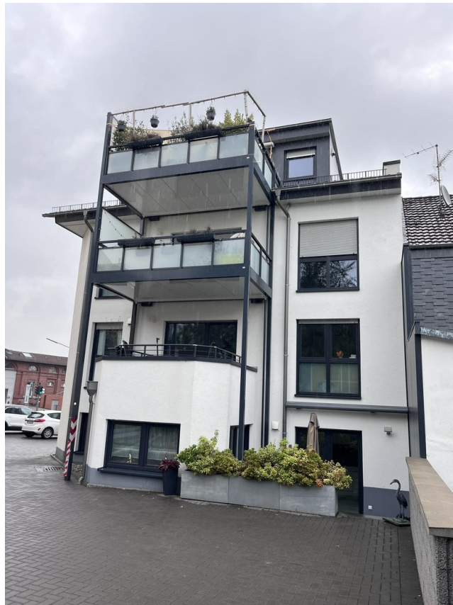
Ansicht von hinten