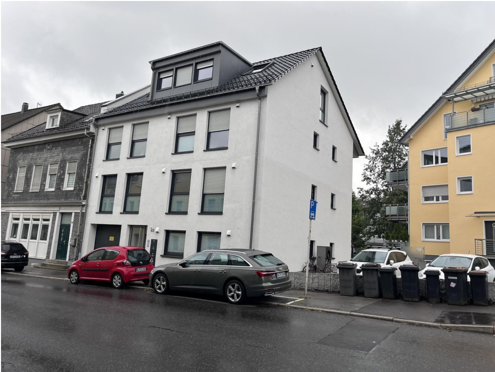
Ansicht von vorne