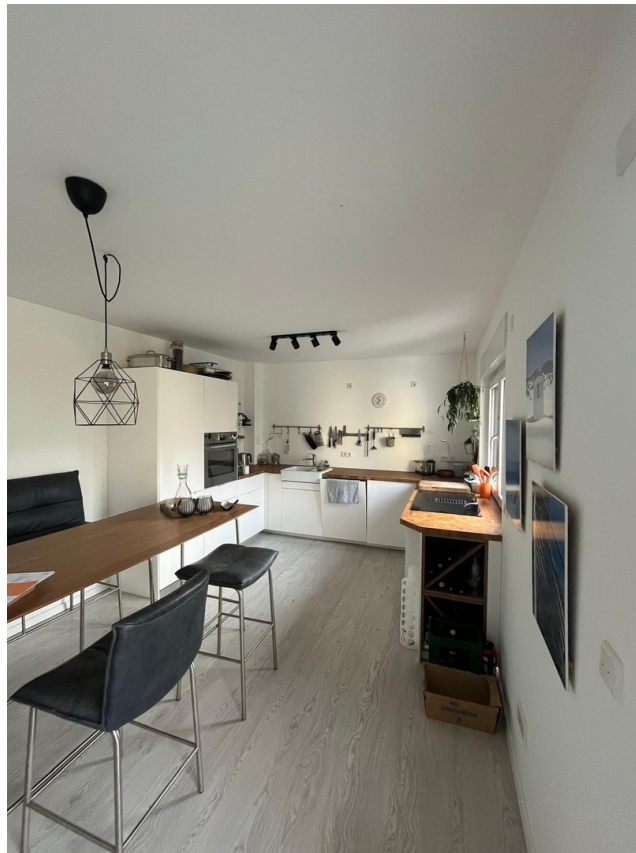
Küche / Esszimmer