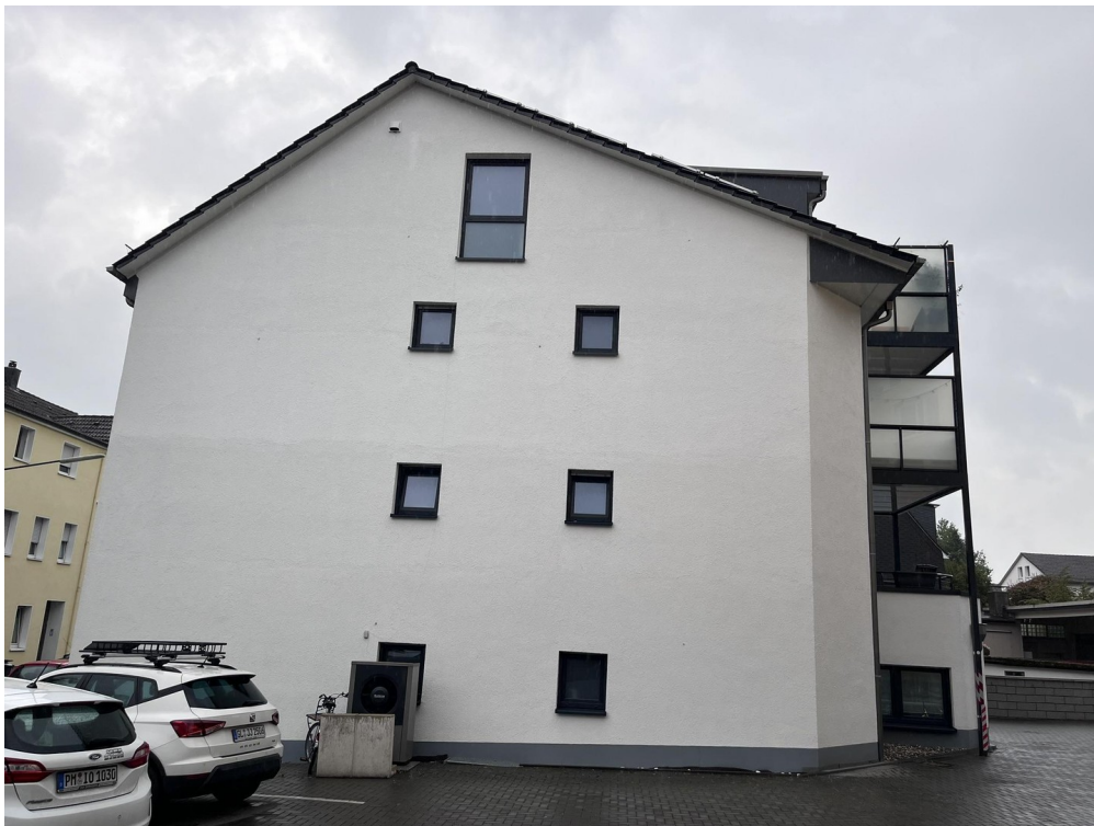
Ansicht vom Hof