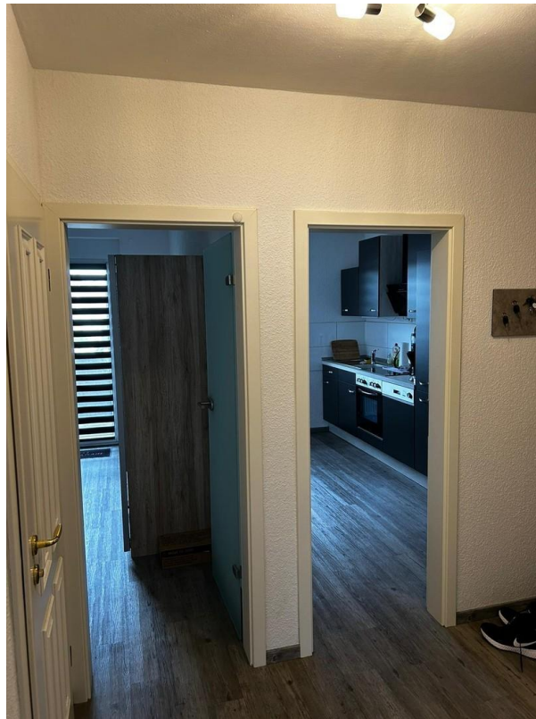
Eingang Küche und Schlafzimmer