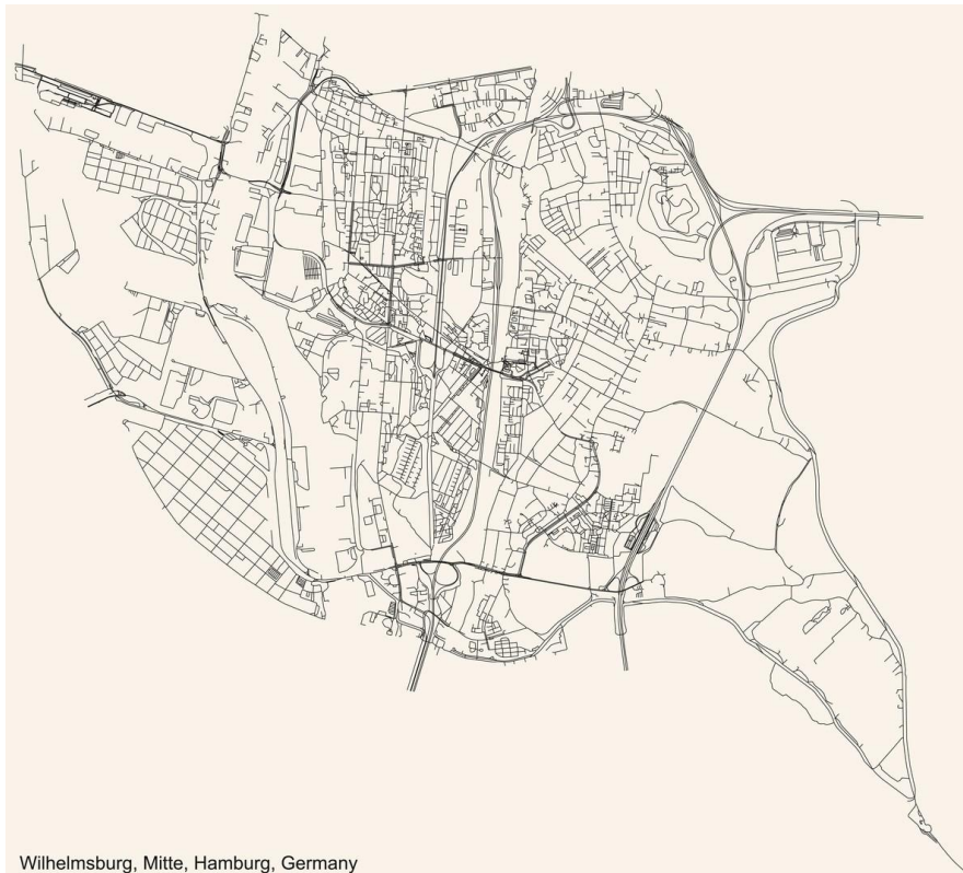
Wilhelmsburg, Mitte, Hamburg, Germany