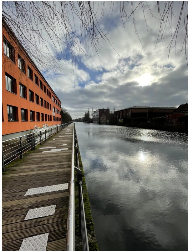
Veringkanal 2 min. zu Fuß