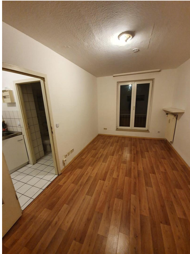
Wohn- und Schlafraum