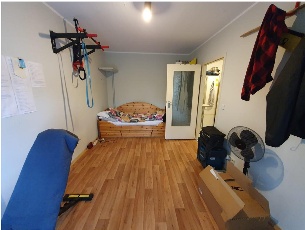
Wohn- und Schlafraum