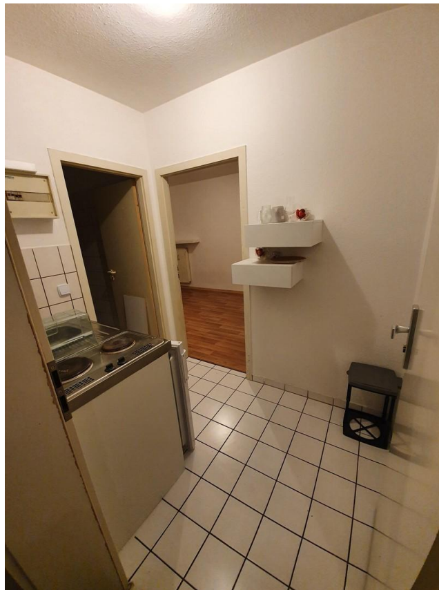
Flur mit Pantryküche