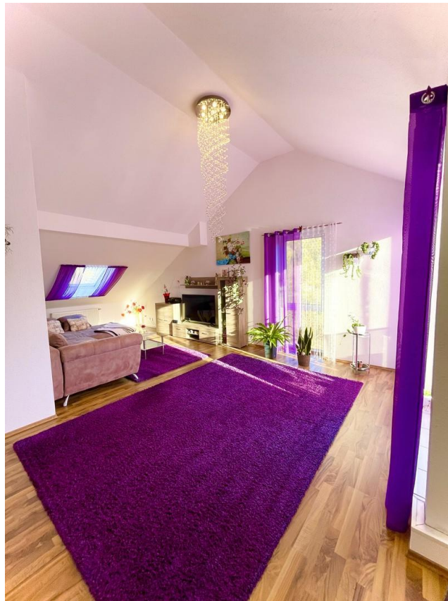
offener Wohn- und Essbereich