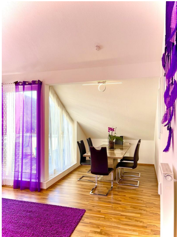
offener Wohn- und Essbereich