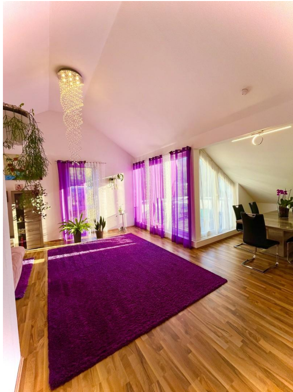
offener Wohn- und Essbereich