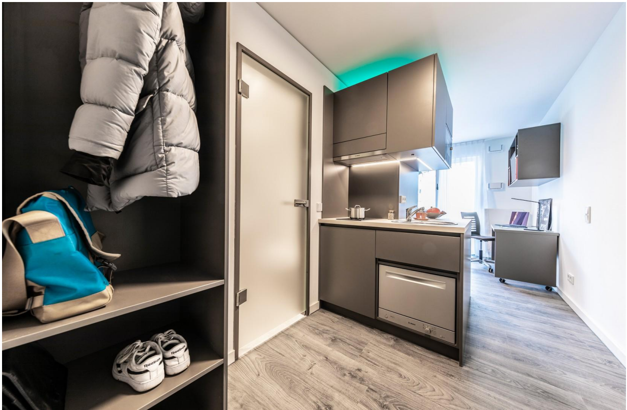
Eingangsbereich und Küche