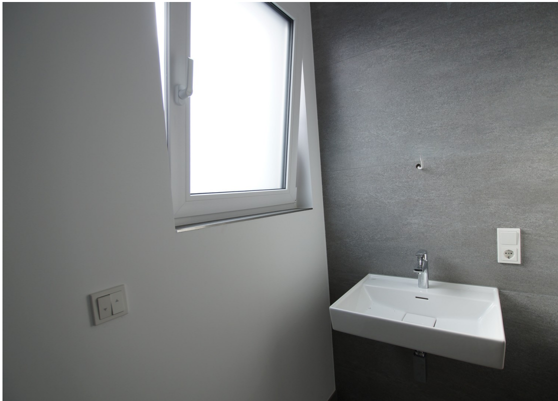
Gäste-WC mit Fenster