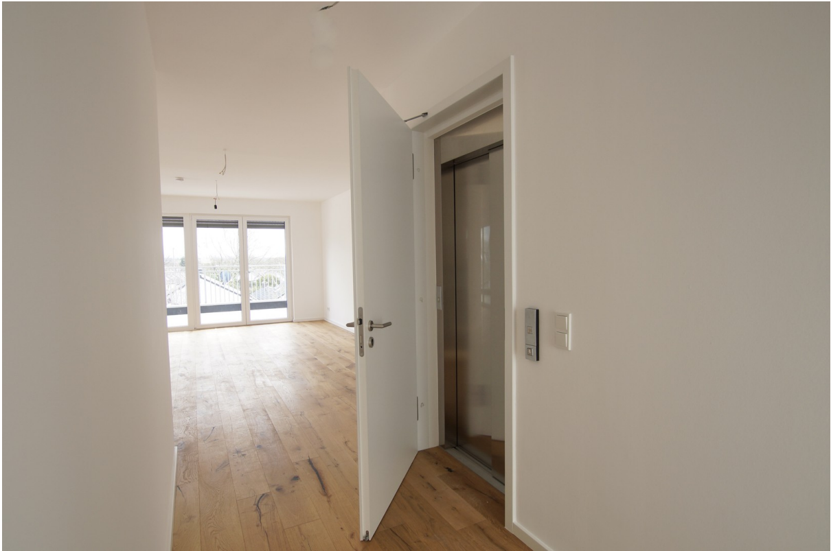
Aufzug bis in die Wohnung