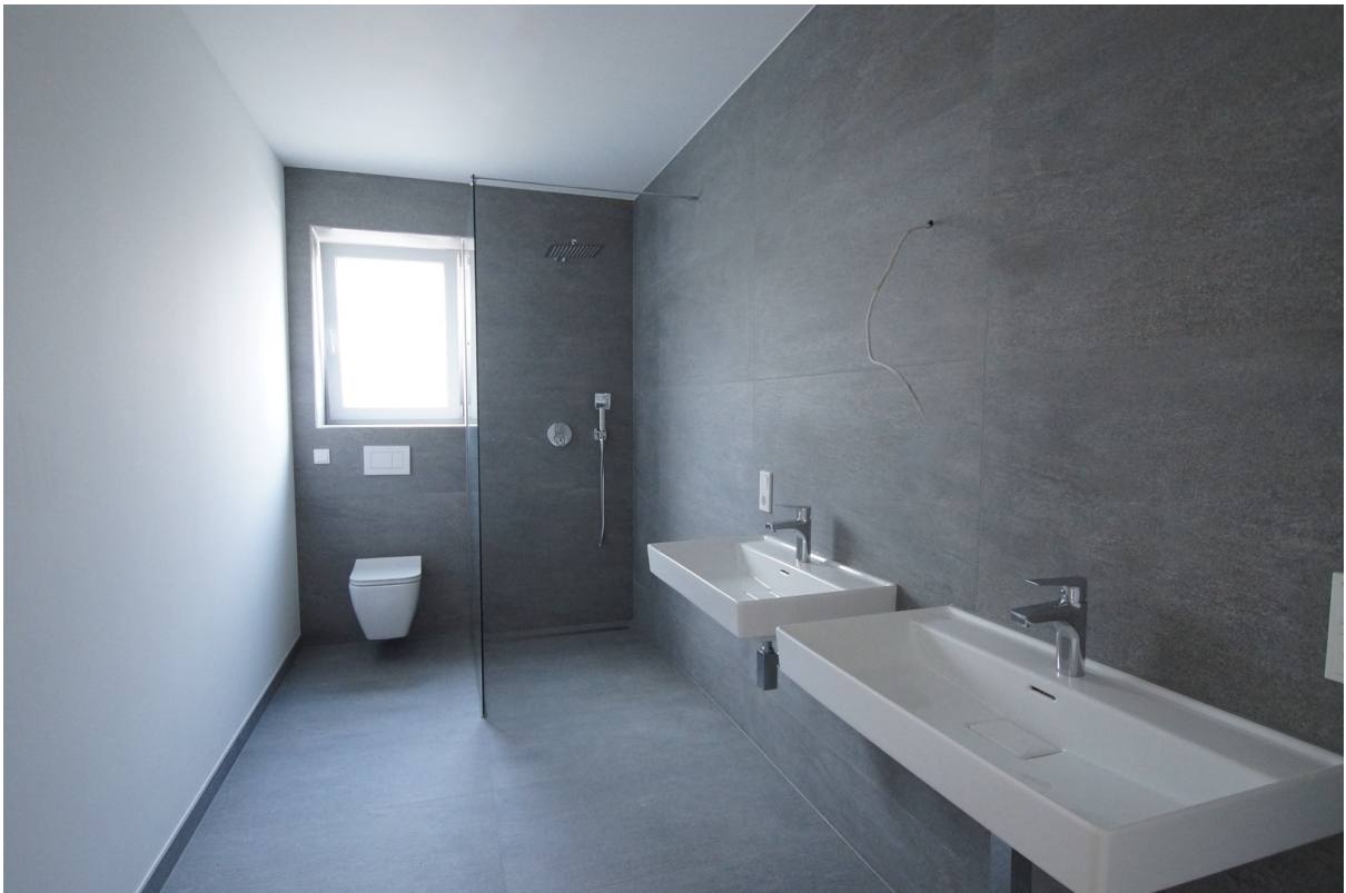
Duschbad mit 2 Waschbecken