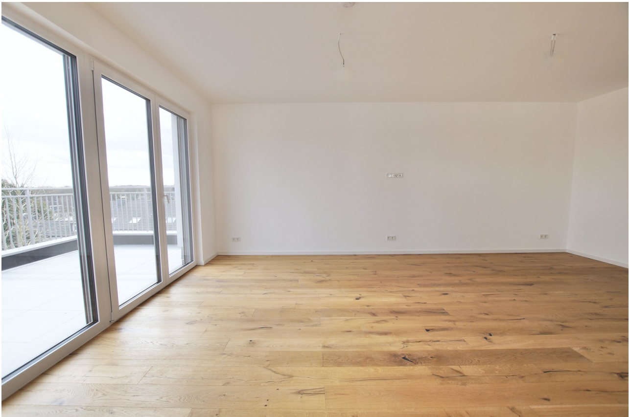
Wohnen mit Fensterfront