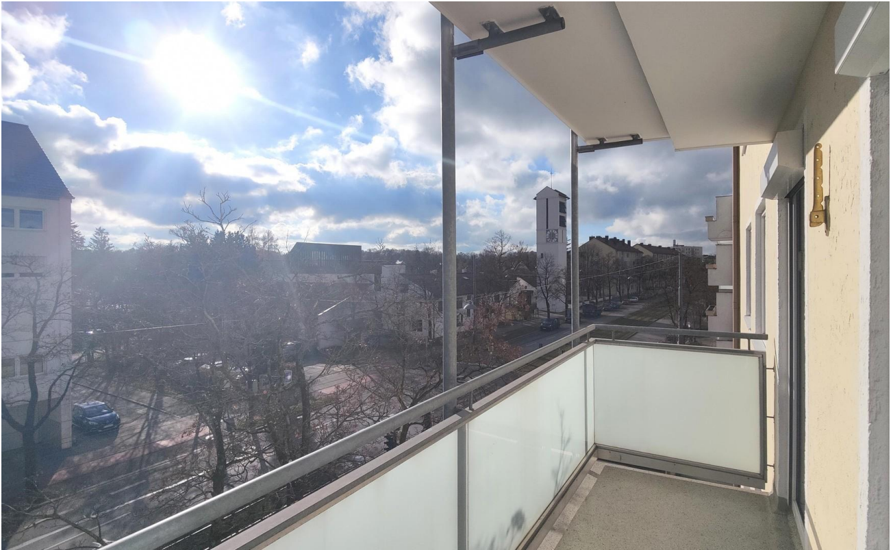
Balkon Blick Richtung Westpark