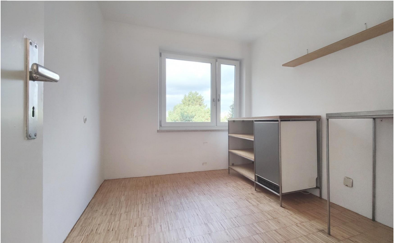
Kochen & Essen