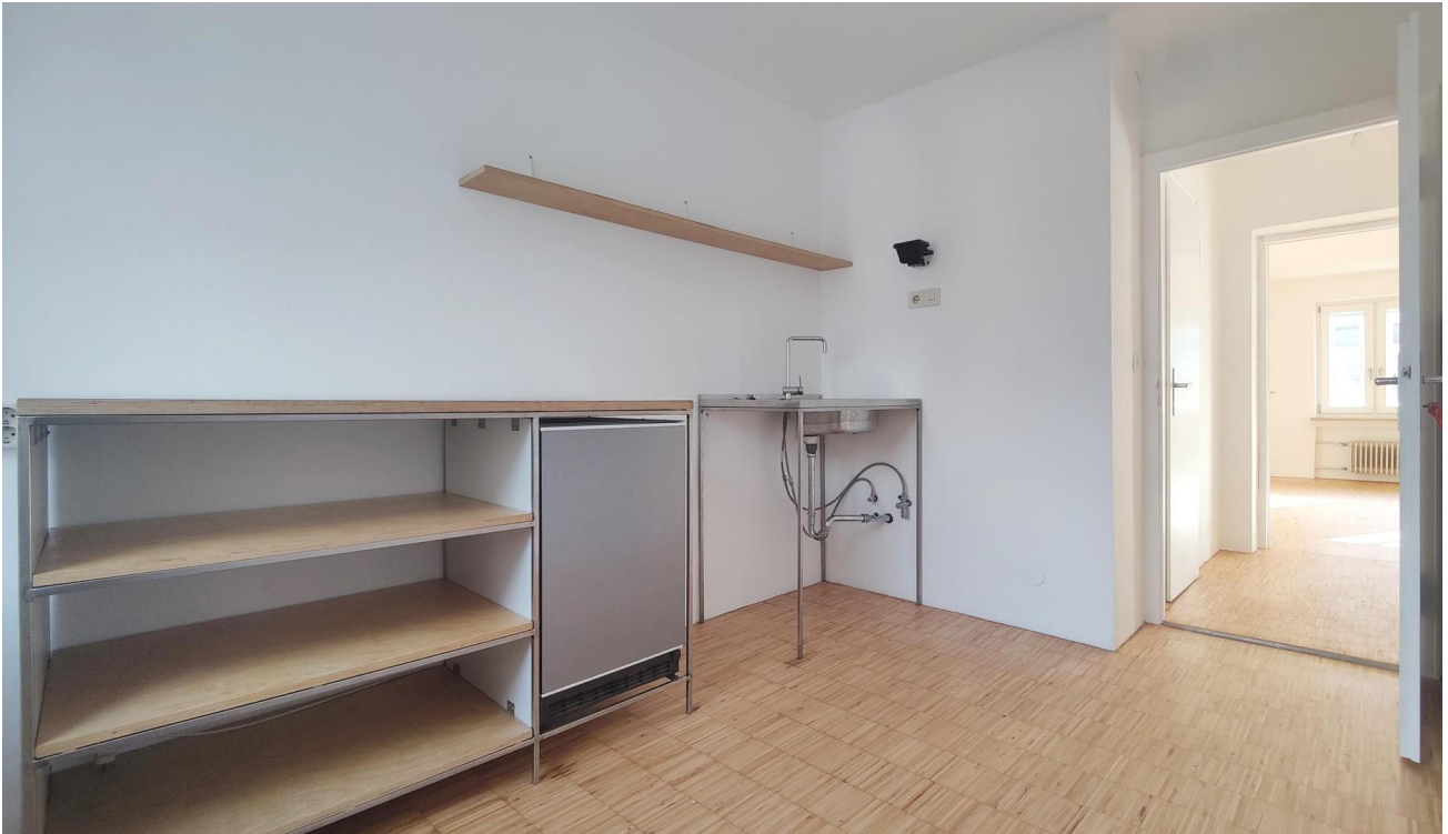
Kochen & Essen