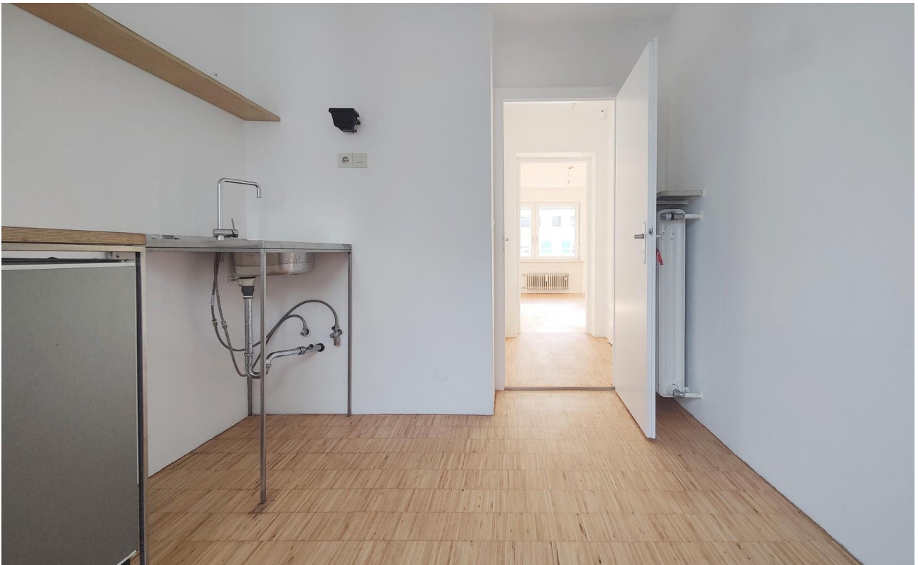
Kochen & Essen