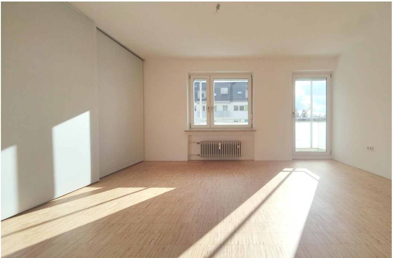
Wohnen & Schlafen