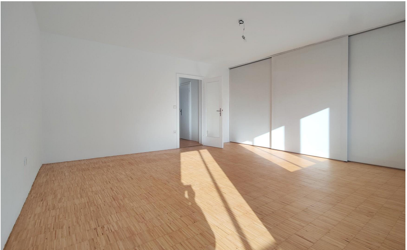
Wohnen & Schlafen