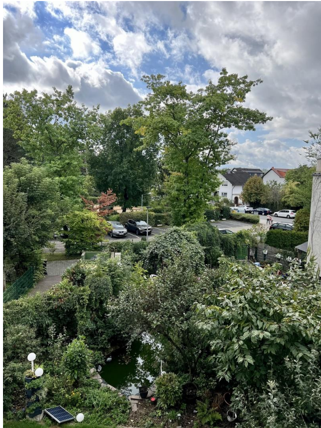
Aussicht / Garten