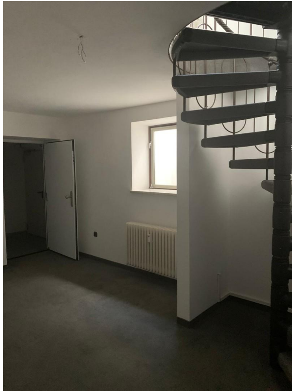
Zimmer mit Zugang zur TG