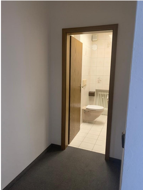
Gardarobe und Gäste WC