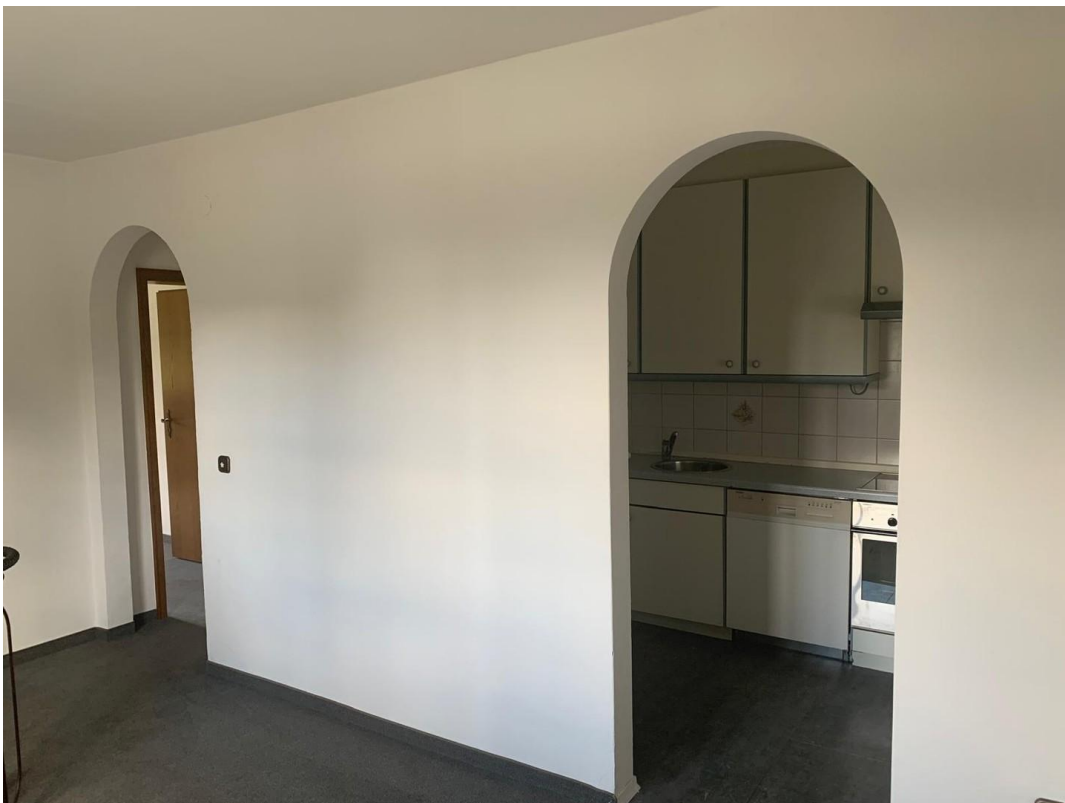
Esszimmer zur Küche