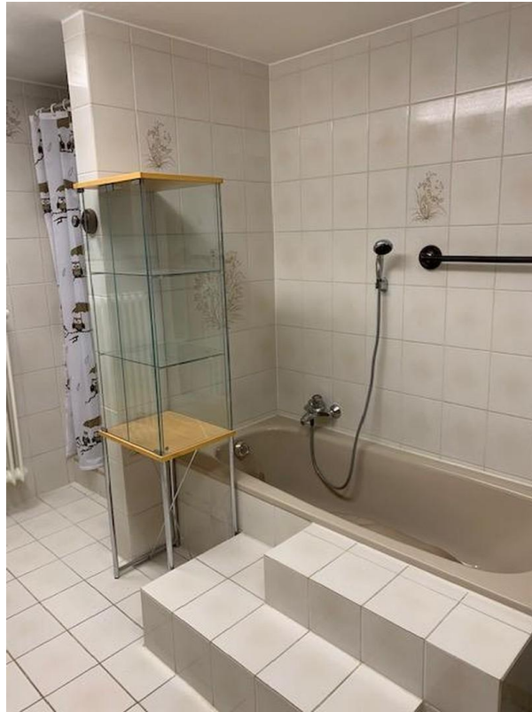
Dusche und Badewanne