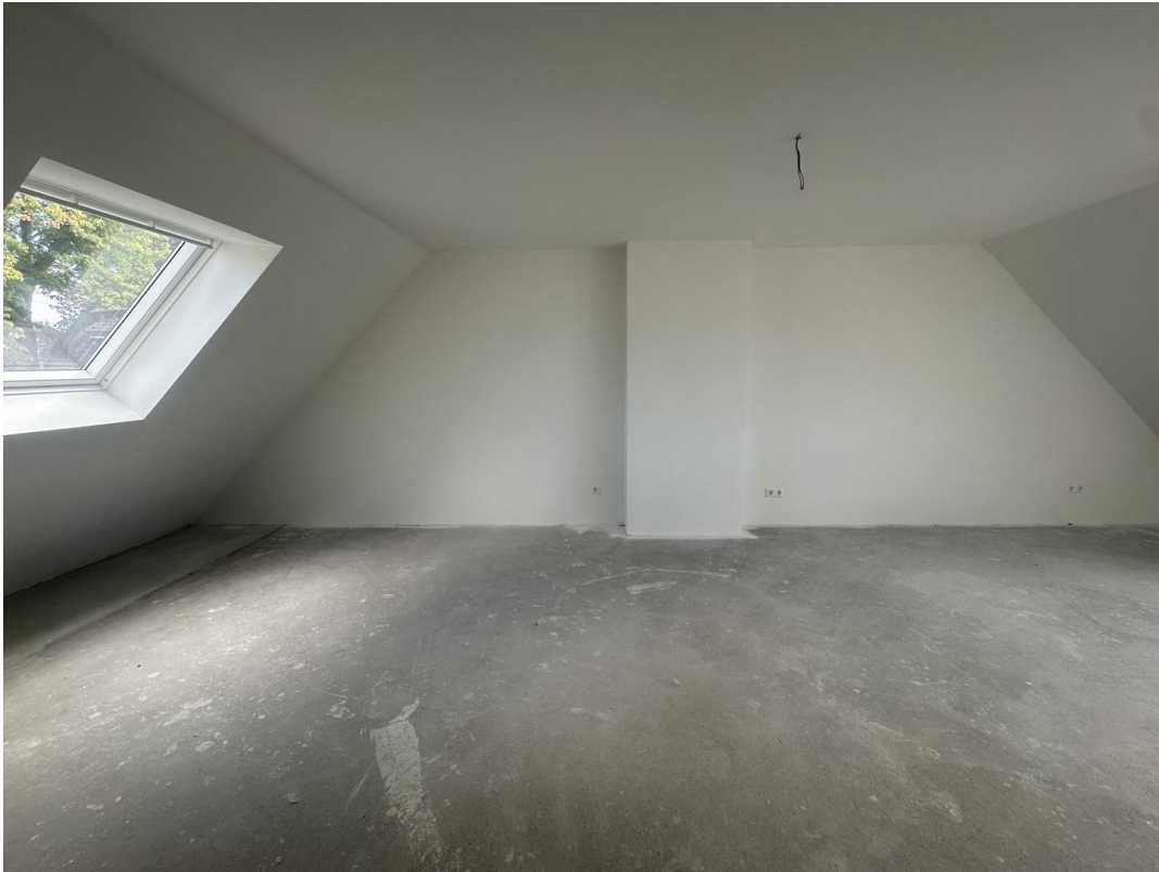
Schlafzimmer Ansicht 1