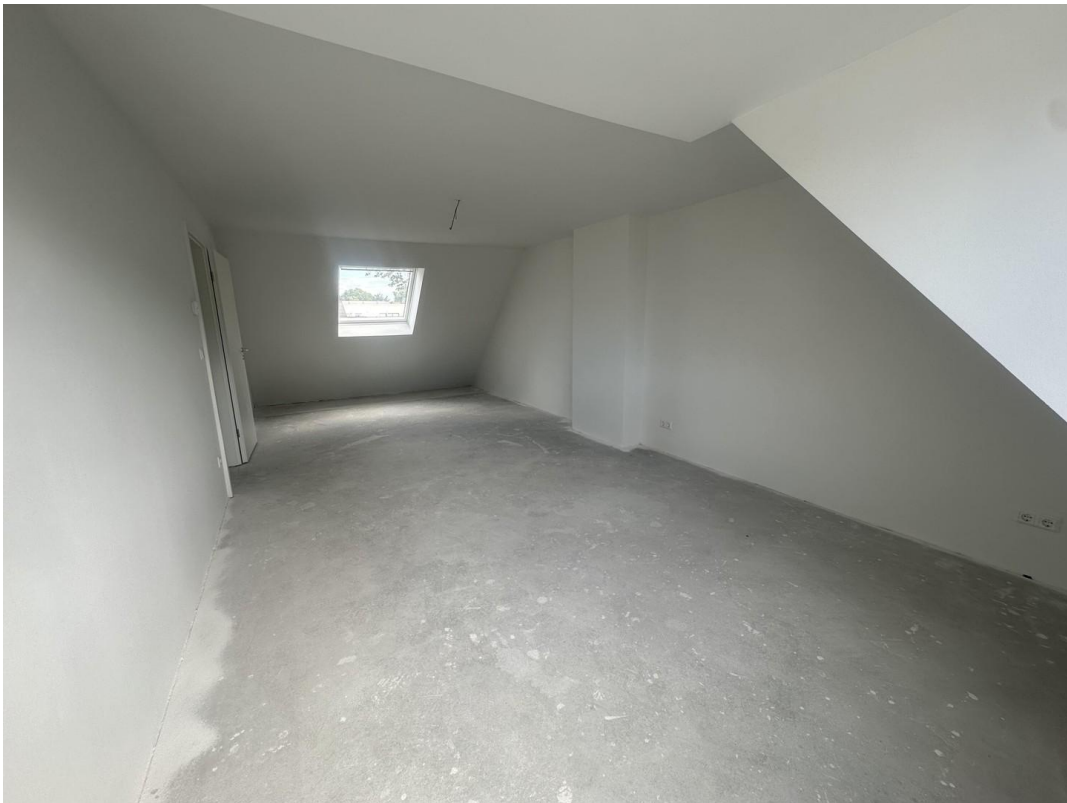
Schlafzimmer Ansicht 2