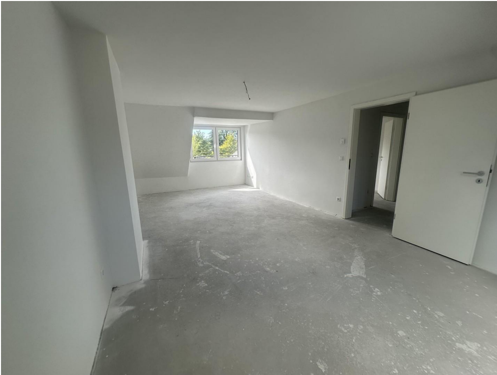
Schlafzimmer Ansicht 3