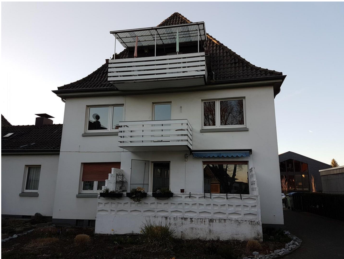
Blick vom Garten aus