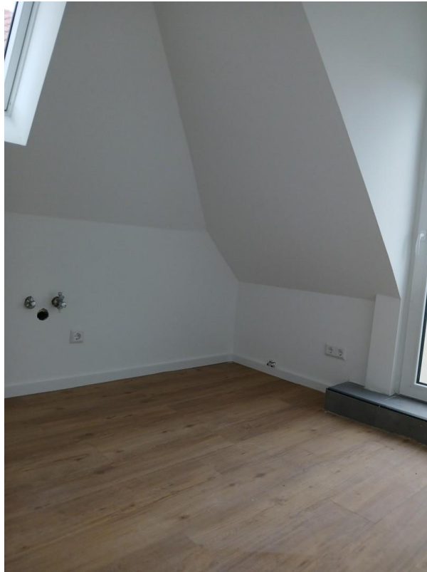
Küche mit Zugang Terrasse