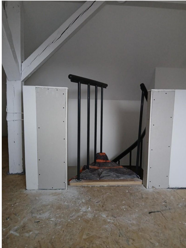
Dachspitz zur Raumspartreppe