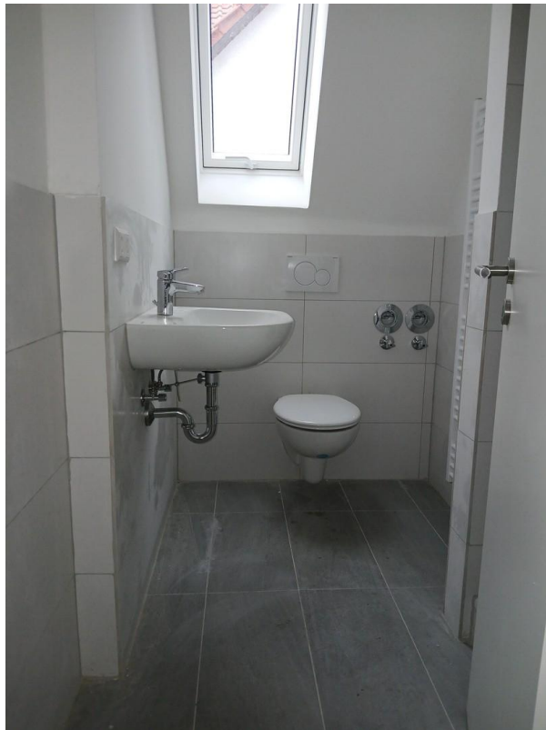
Duschbad mit WC