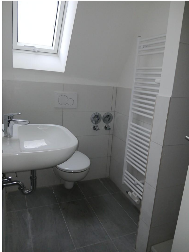
Duschbad mit WC