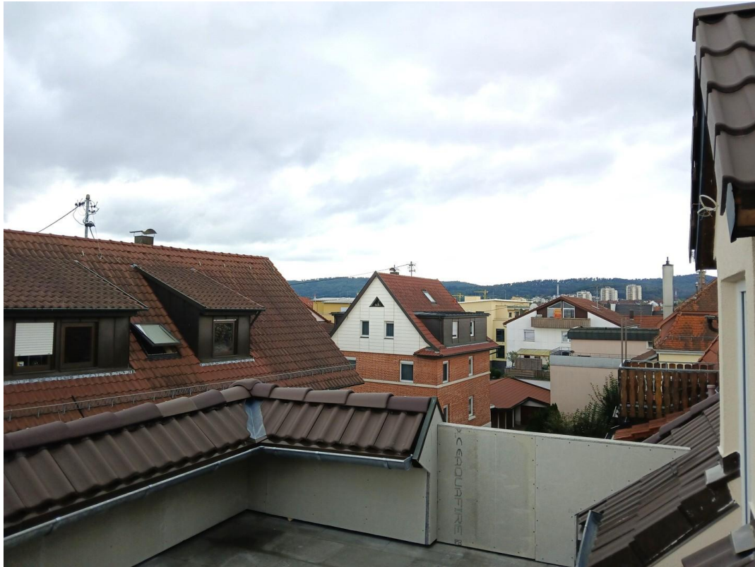
Terrasse - Ausrichtung Süd-Ost