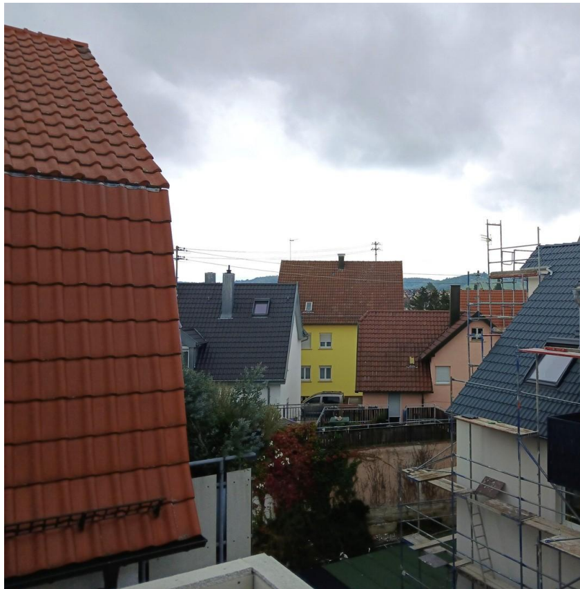
Terrasse - Ausrichtung Süd-Ost