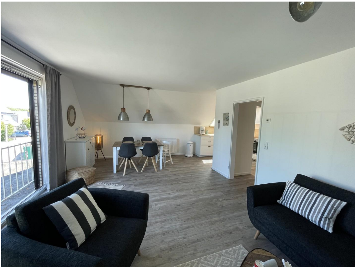
Wohnzimmer und Essbereich