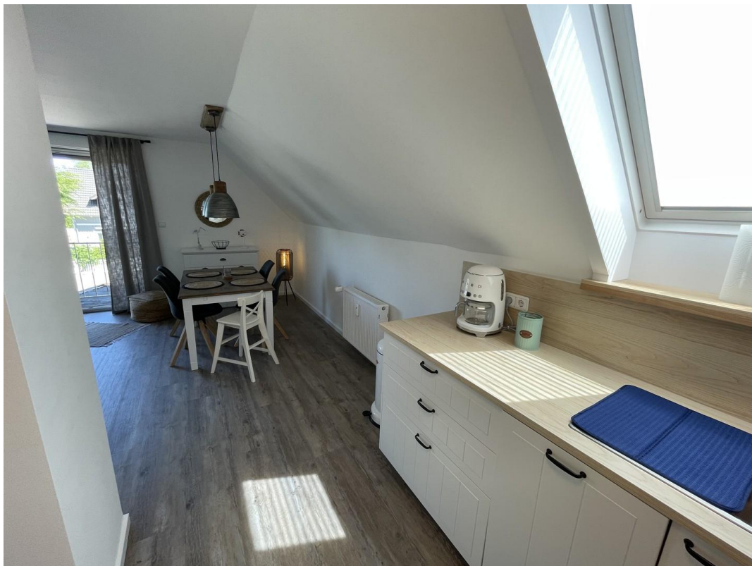
Blick aus der Küche