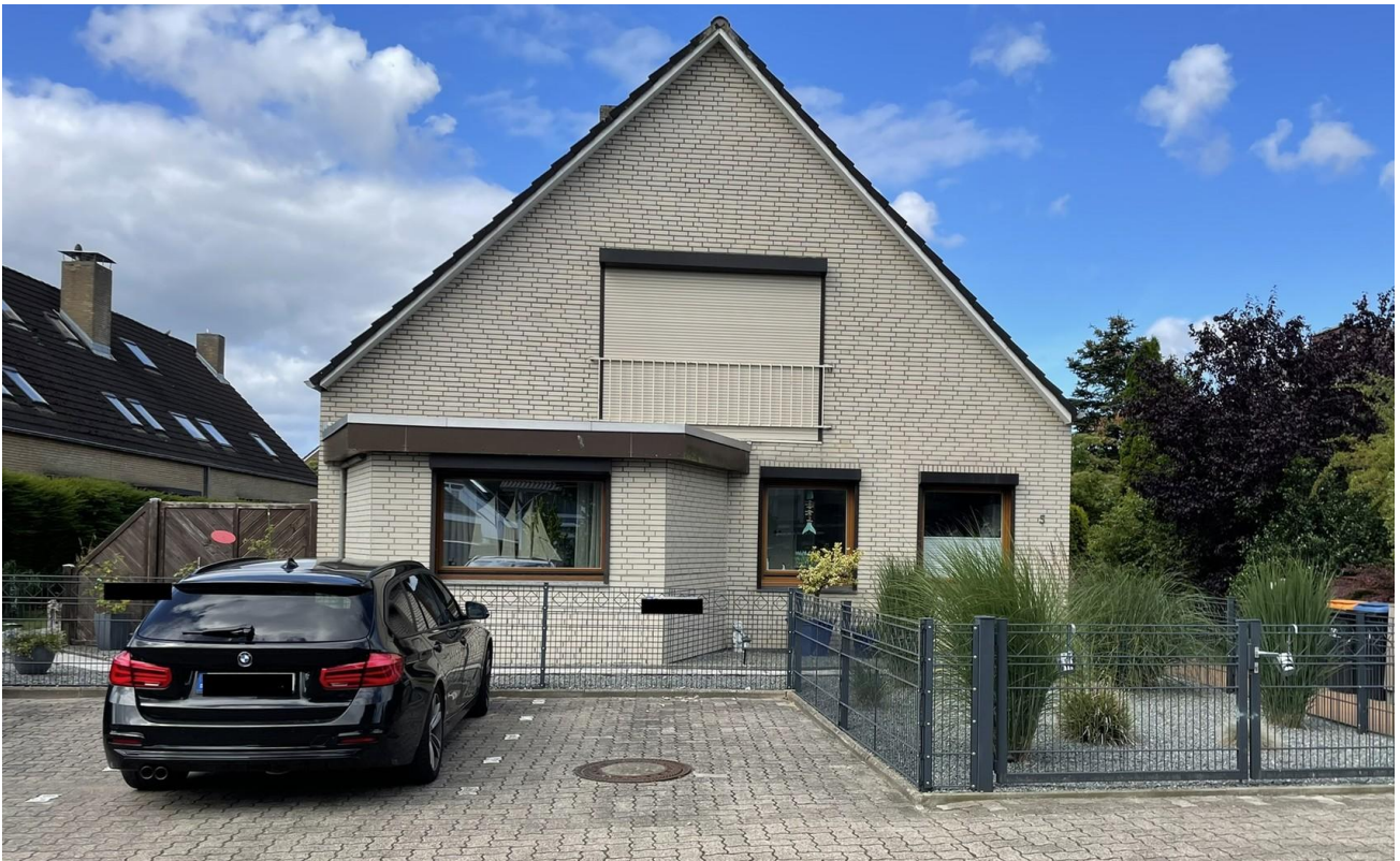
Vorderansicht und Stellplatz