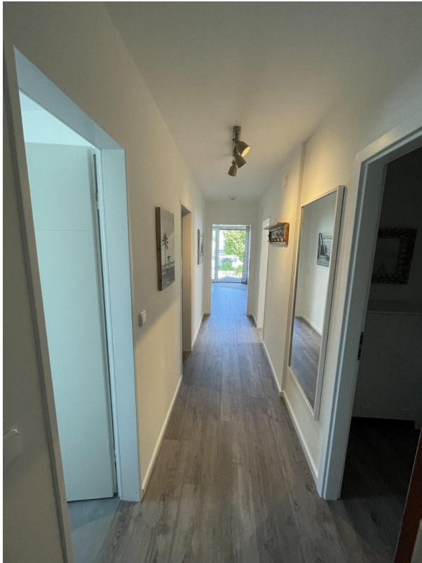
Flur aus Richtung Eingang