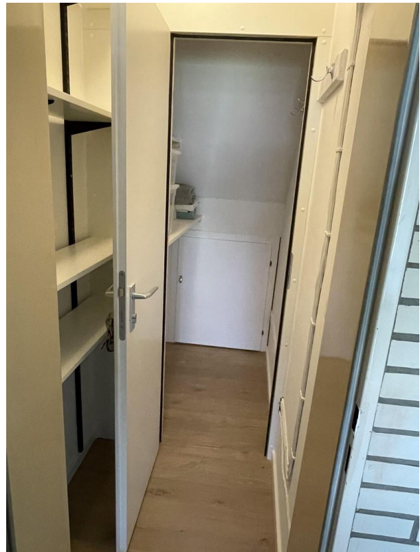
Abstell für Koffer / Privat