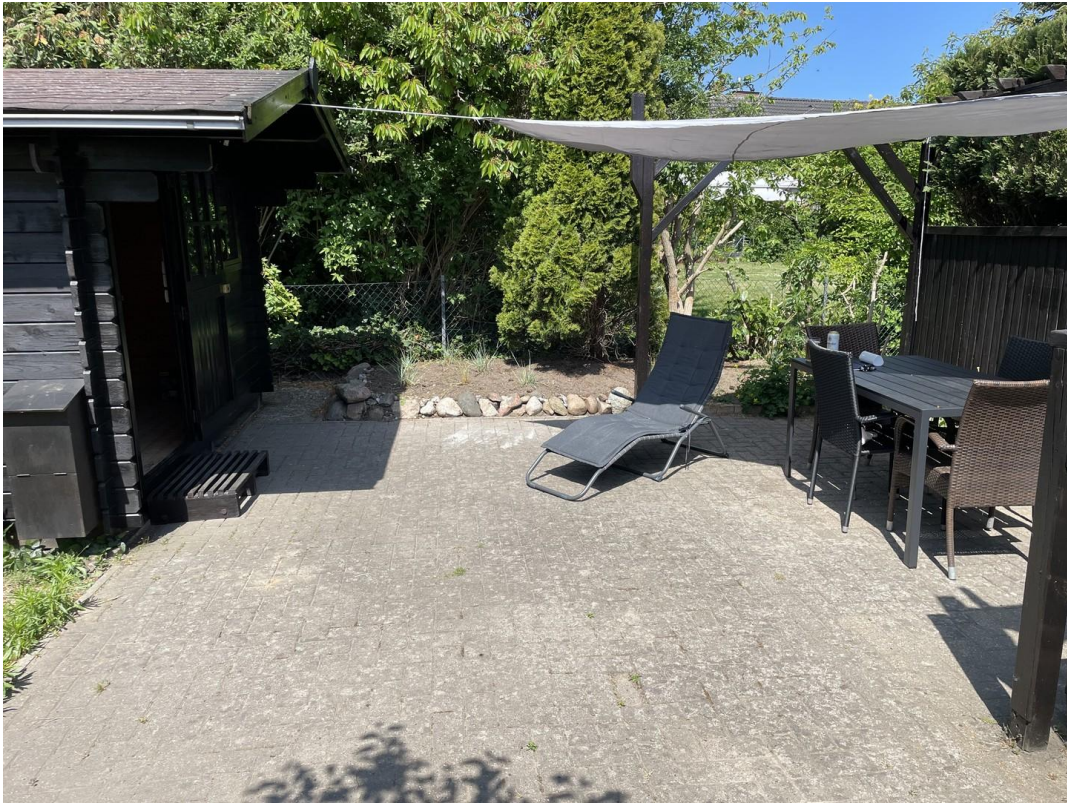
Blockhütte mit Grillplatz