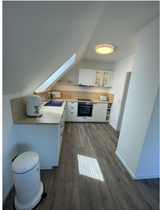
Küche aus Sicht Essbereich