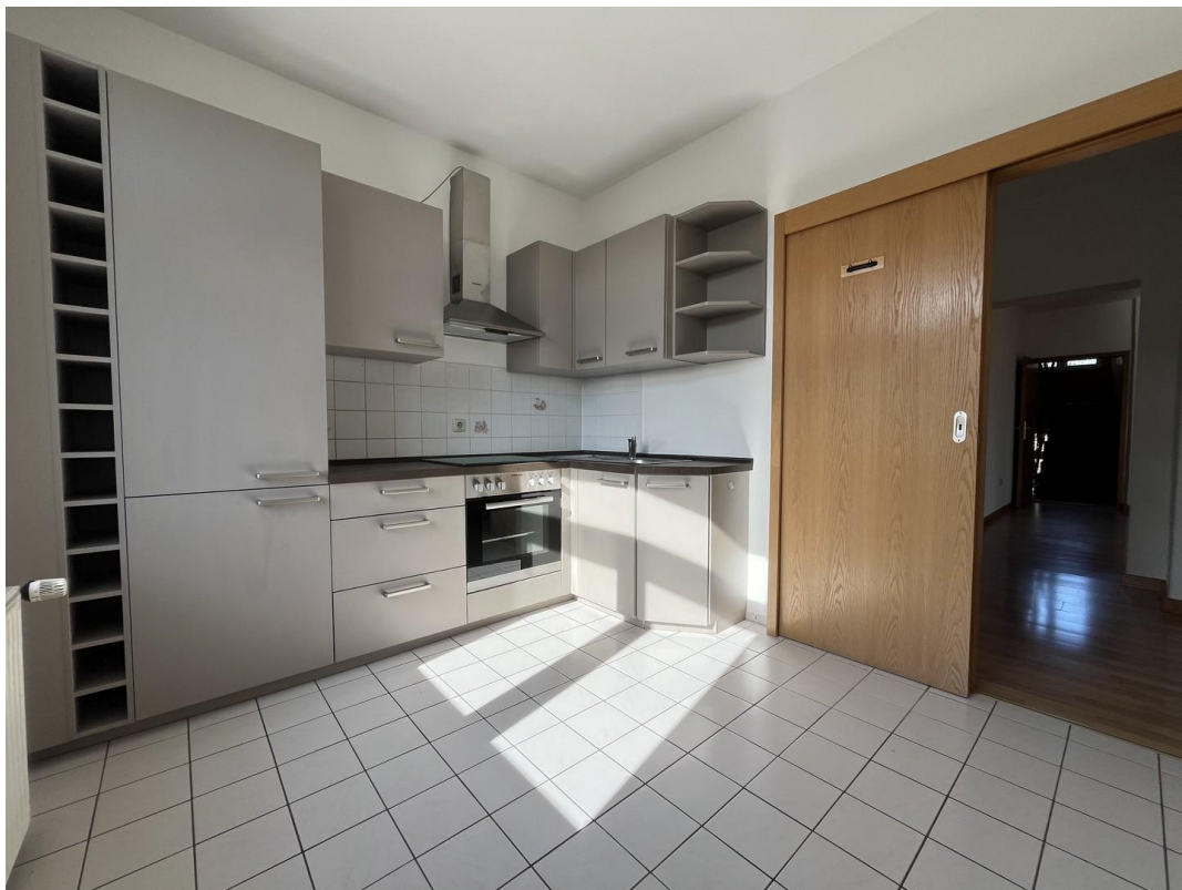
Küche inkl. EBK