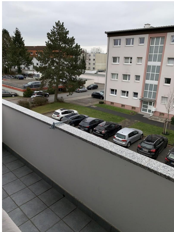
Balkon und Aussicht