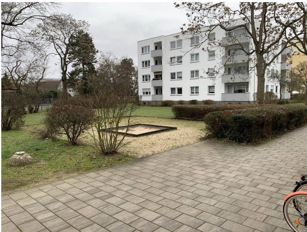
Spielplatz und viel Grünfläche