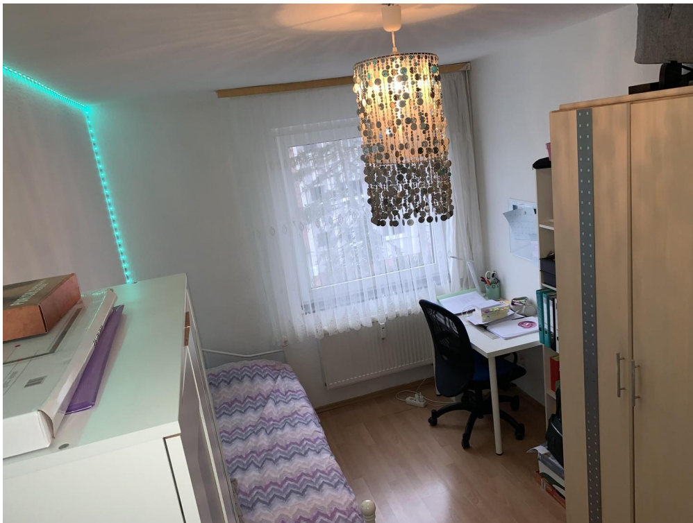
Kinderzimmer / Büro