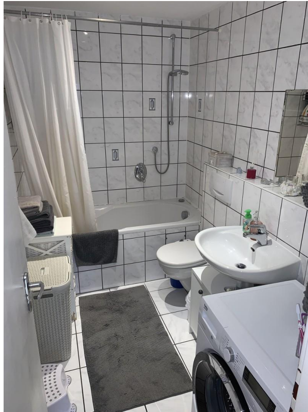
Bad mit Badewanne