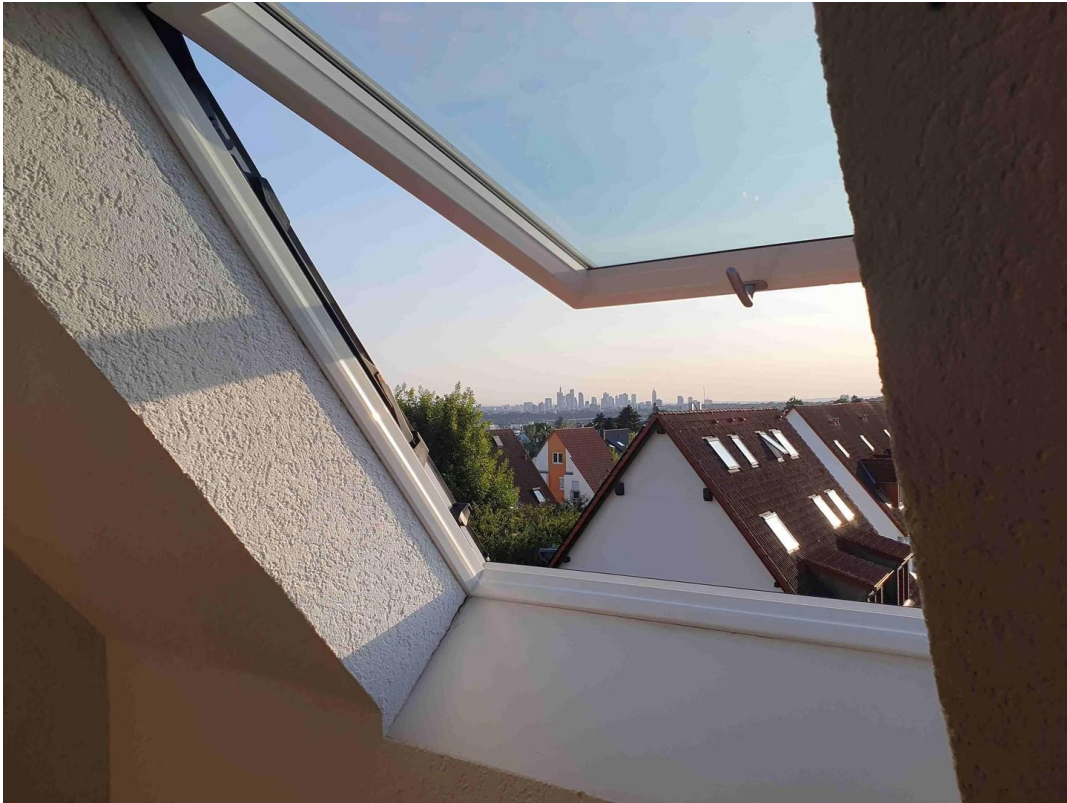
Dem Himmel ganz nah.