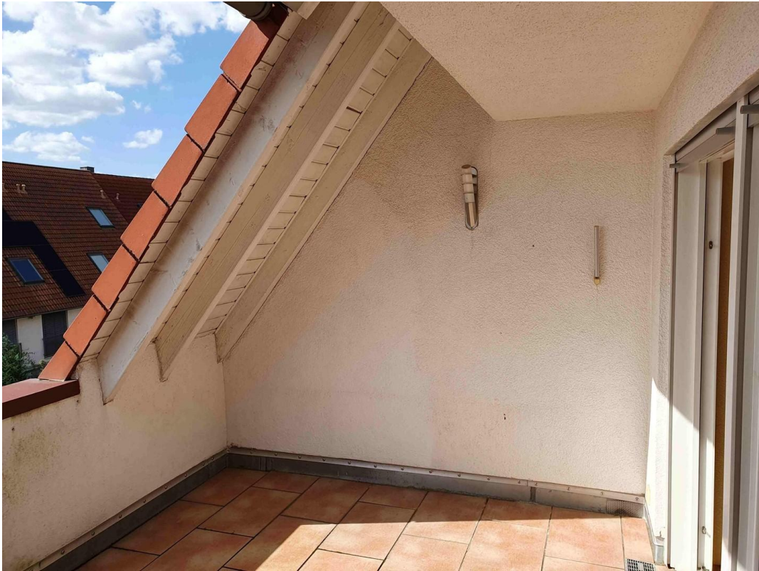
Terrasse im Dachausschnitt