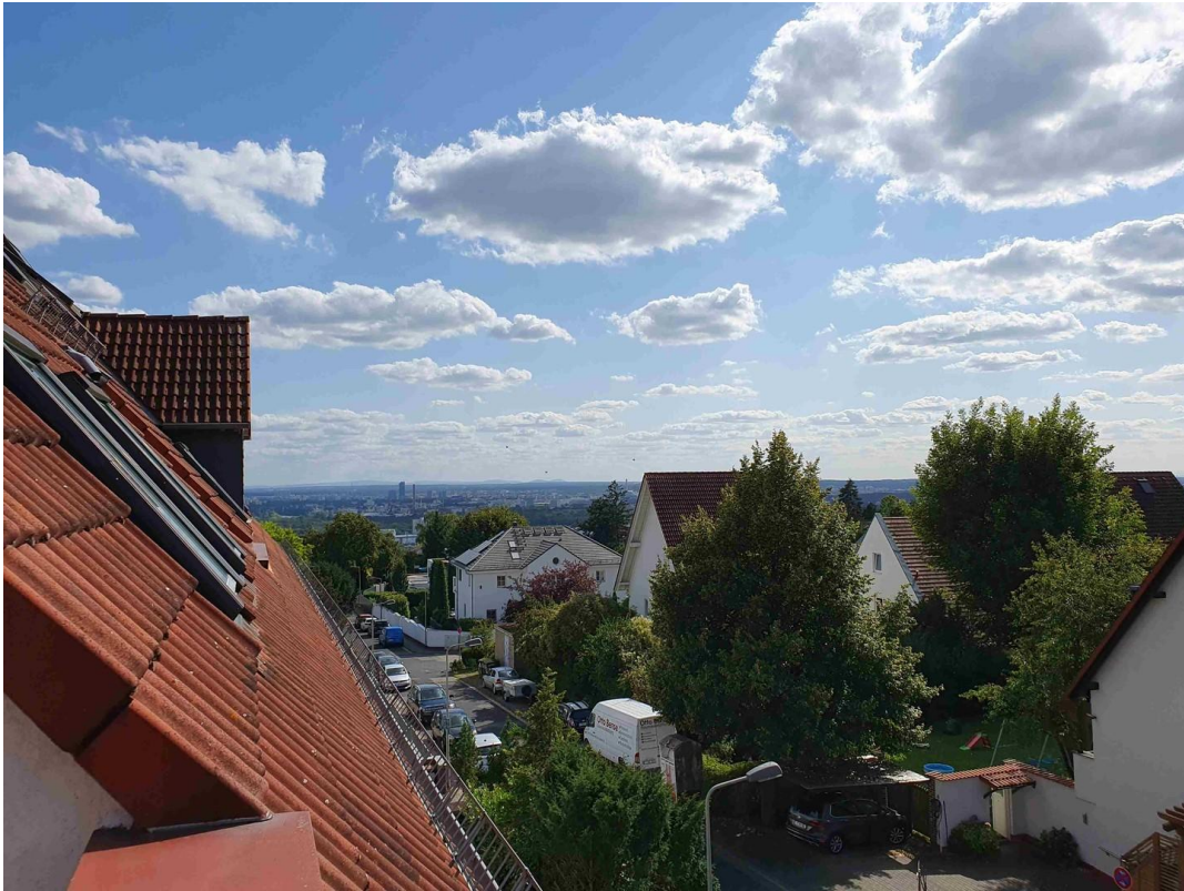
Aussicht bis Frankfurt-Skyline