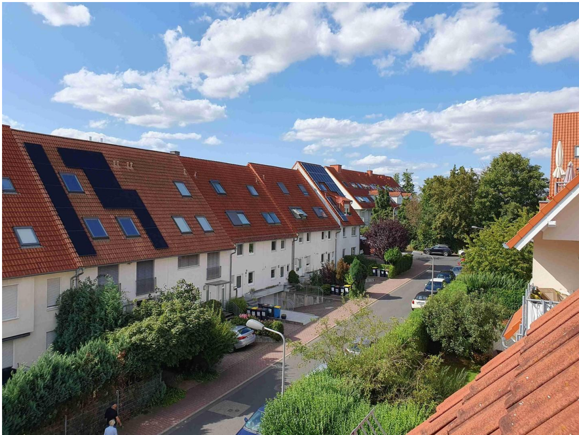
Aussicht bis zum Spessart