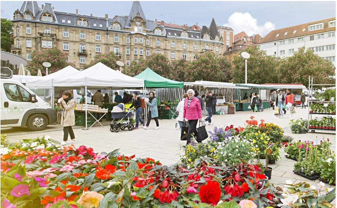
Wochenmarkt am Marienplatz