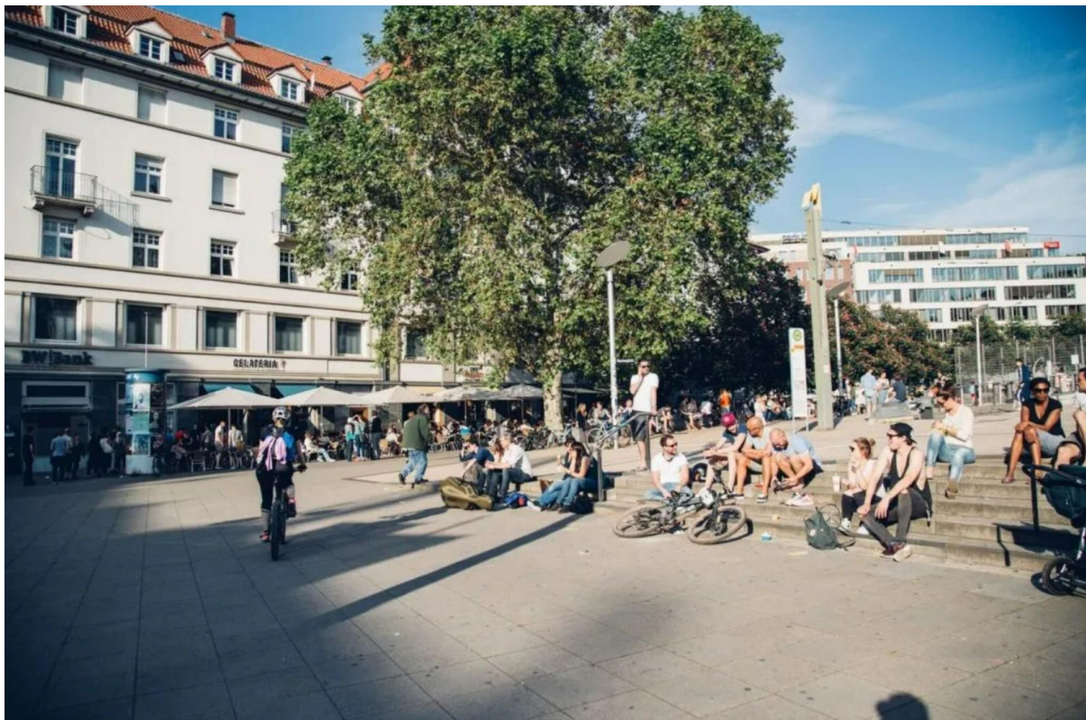
Das Café Kaiserbau