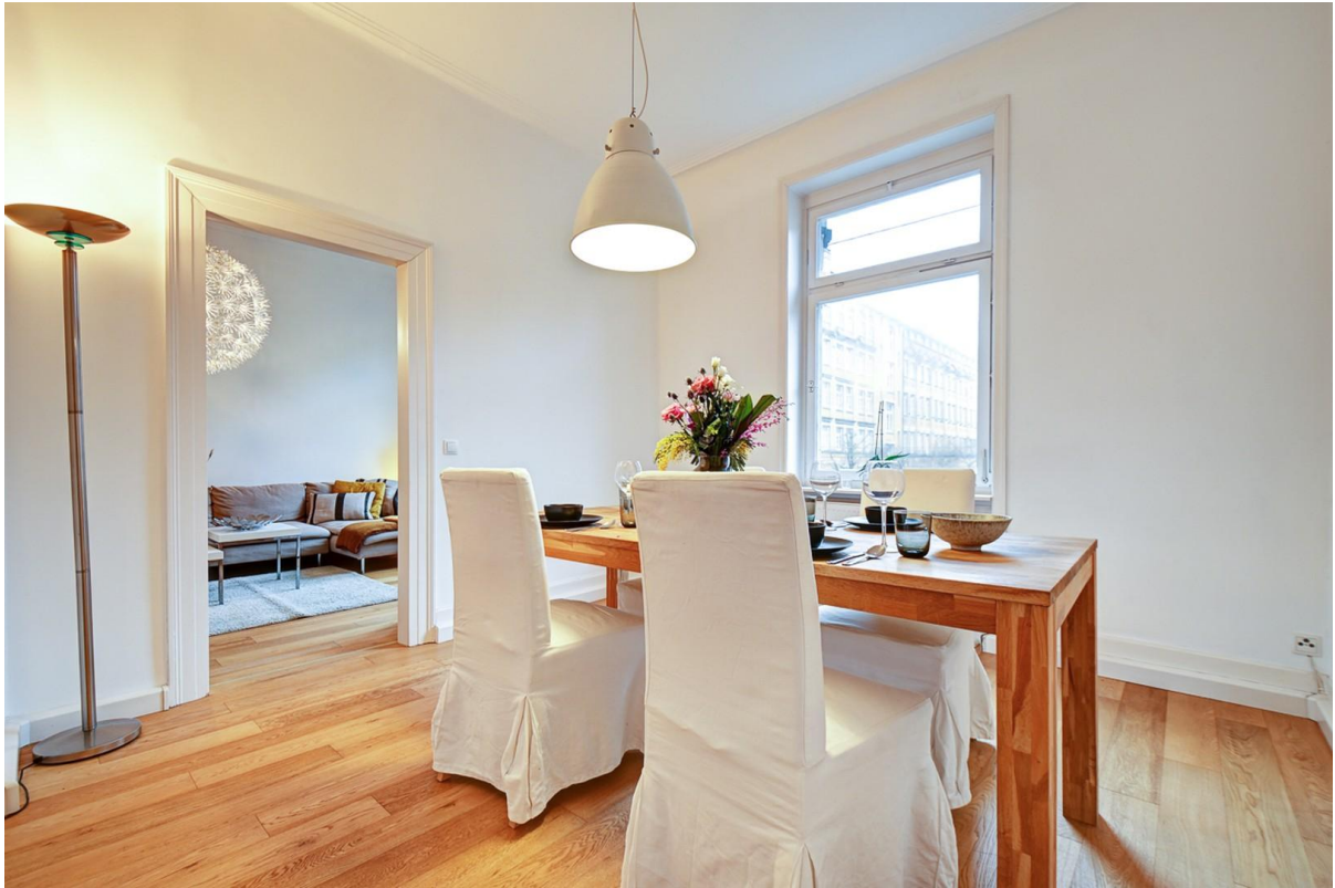
Ess-/Arbeits- od. Kinderzimmer