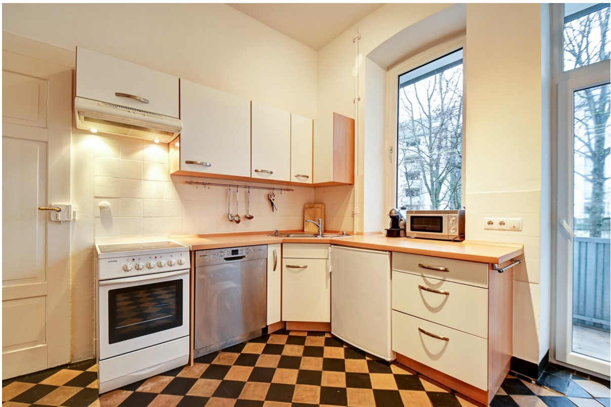
große Küche mit Balkonzugang