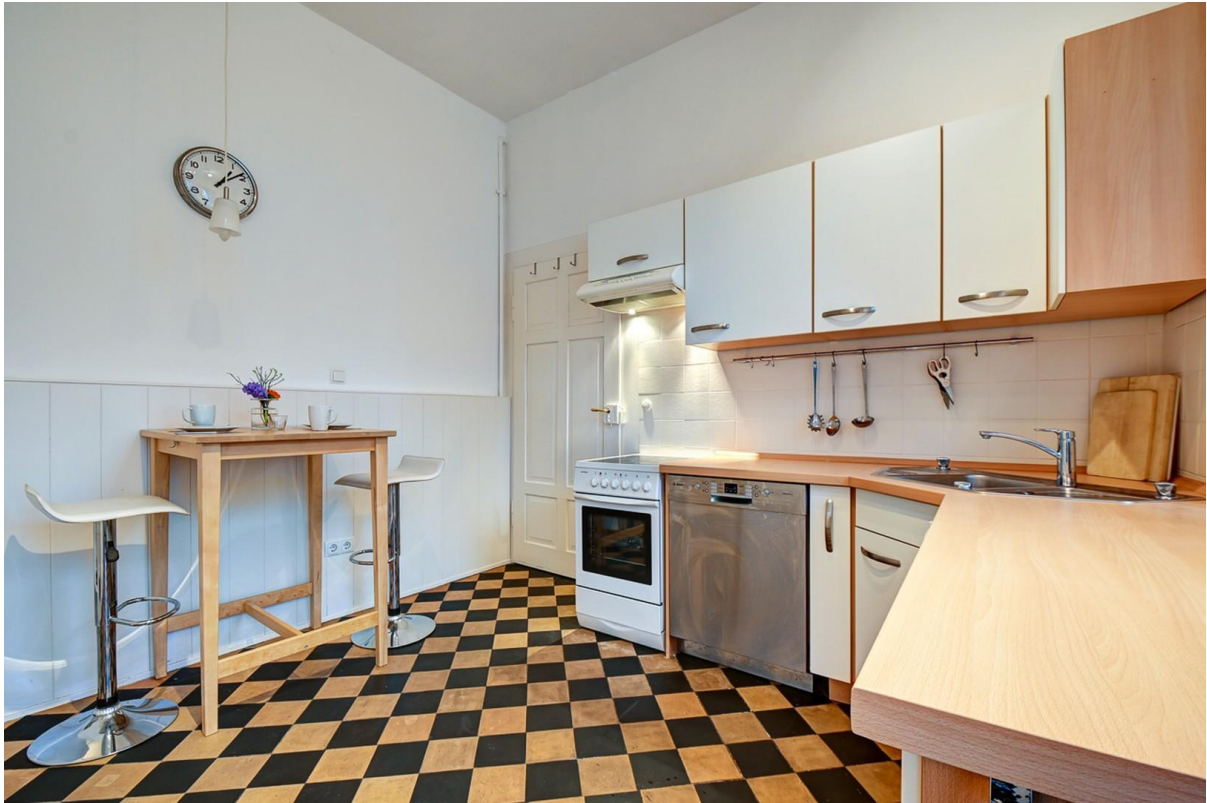
Küche mit Frühstückstisch