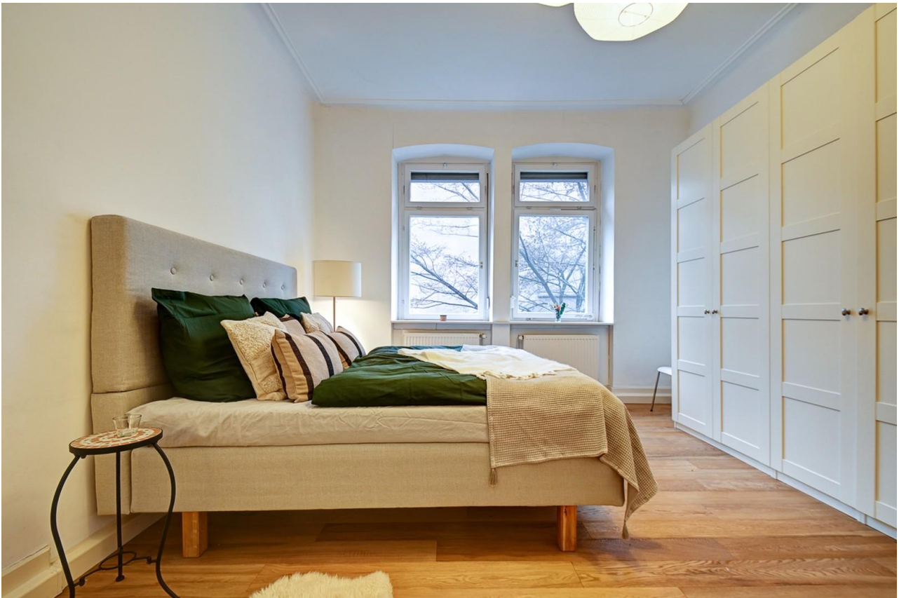
Schlafzimmer mit viel Platz