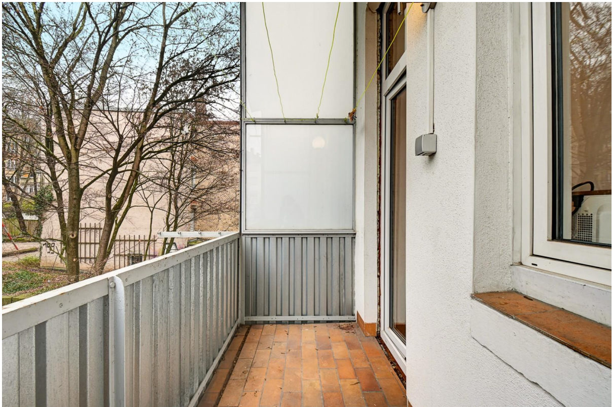
Balkon zum grünen Innenhof